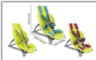
Seduta in colore verde