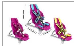
Seduta in colore rosa