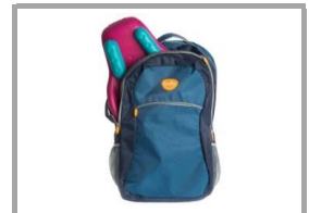
Maxi zaino Backpack