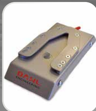
DAHL DOCKING och fästelement för montering i fordon.