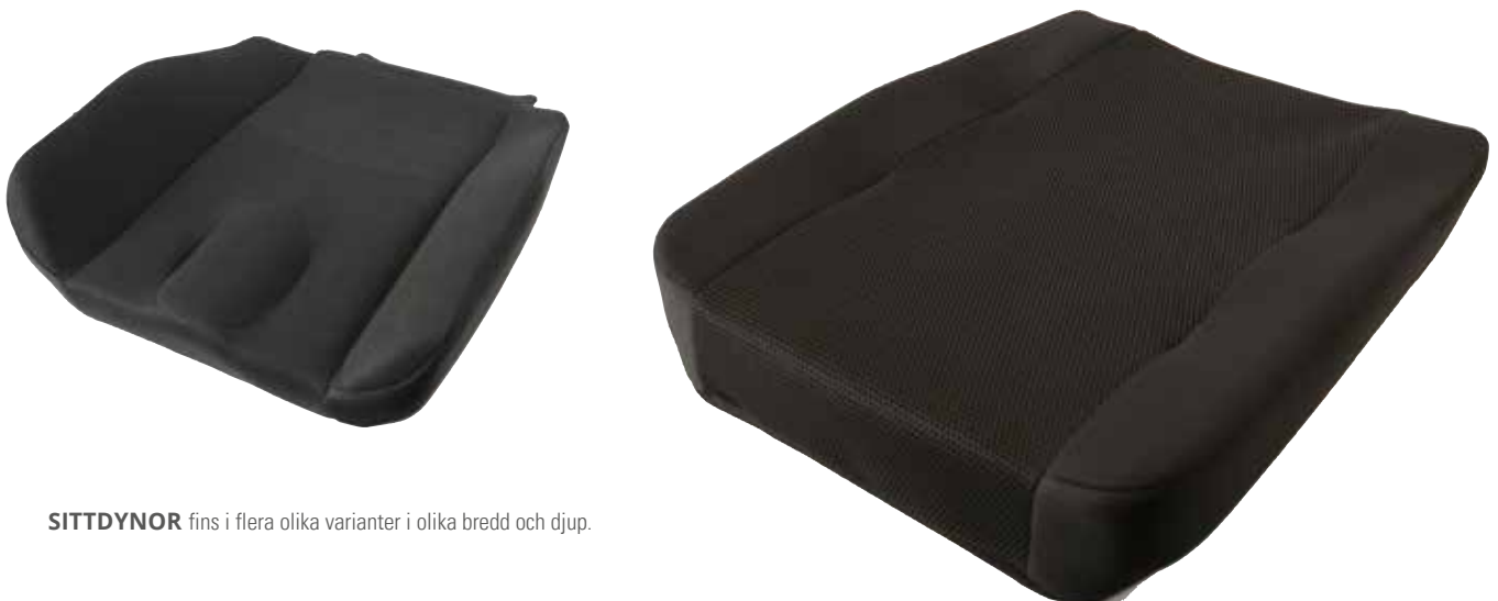
SITTDYNOR finns i flera olika varianter i olika bredd och djup.