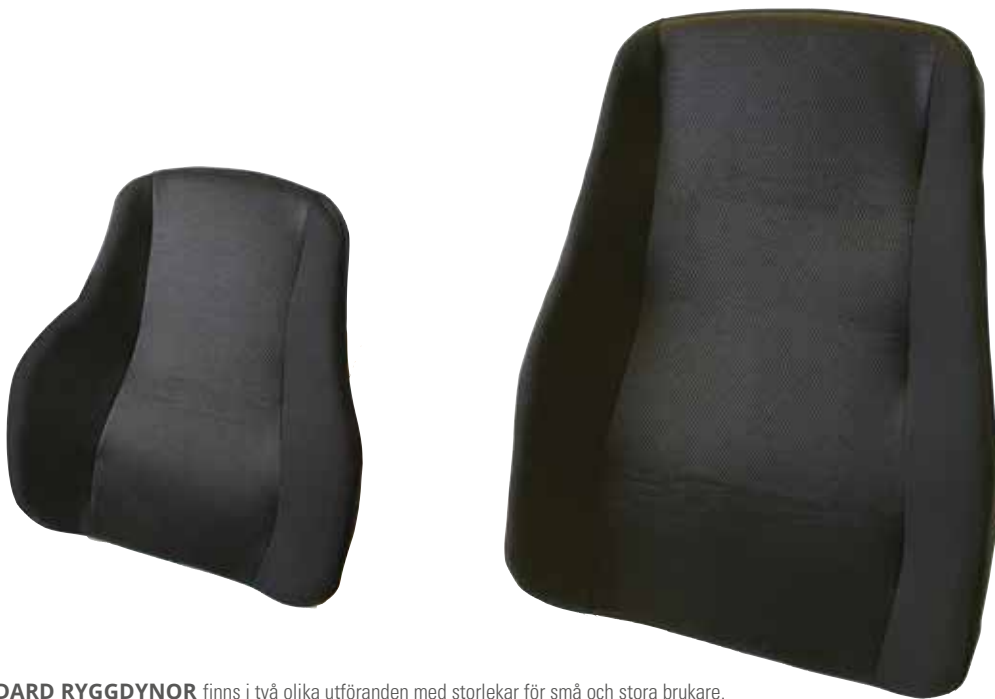
STANDARD RYGGDYNOR finns i två olika utföranden med storlekar för små och stora brukare.

SITTSYSTEM MED HÖG KOMFORT OCH ANPASSNINGSMÖJLIGHETER FÖR OLIKA TYPER AV SITTPROBLEMATIK. RYGG- OCH SITTDYNORNA ANPASSAS EFTER DINA BEHOV.