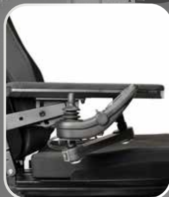
UPPFÄLLBARA ARMSTÖD och svängbar styrenhet gör det enklare att komma närmare.