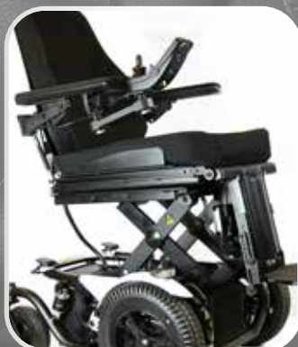
STABIL SITTLYFT Tryggt och stabilt säte.