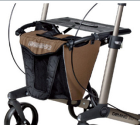
// 7104024 Castanha / preta