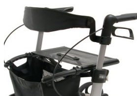
// 7109020 Encosto