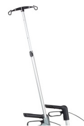
// 7109100 Suporte de soro