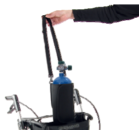
// 7109050 Suporte para garrafas de oxigénio