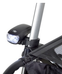
// 7109095 Luz