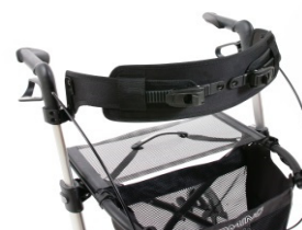
// 7109035 Encosto ajustável confort