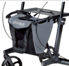
// 7104025 Cinzenta / preta