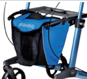
// 7104022 Azul/preta