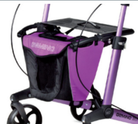
// 7104023 Violeta/preta