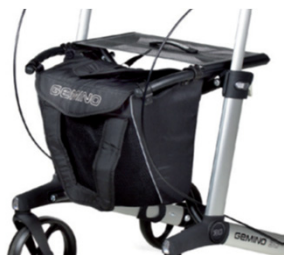
// 7104006 Bolsa Advance com tampa e pegas preta