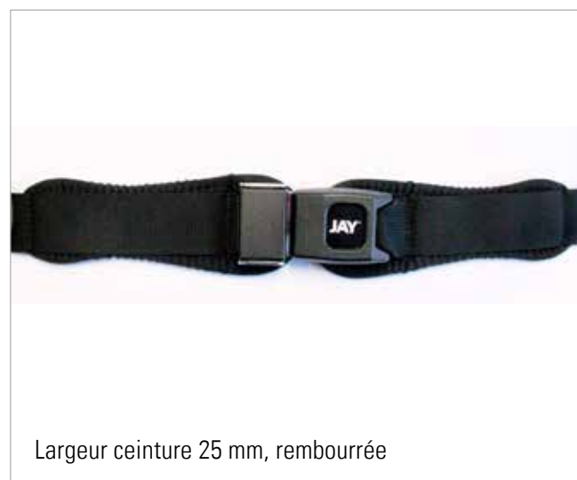
Largeur ceinture 25 mm, rembourrée

Cette ceinture de positionnement offre un soutien simple mais sûr du bassin sur une surface aussi réduite que possible. Différentes largeurs de ceinture et épaisseurs de rembourrage sont disponibles. En outre, le réglage de la boucle peut être simple ou double.