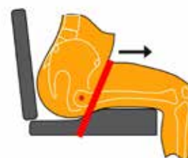
ceinture de bassin 60 - 70°

La ceinture de bassin peut être placée de différentes façons, tenant compte de la direction des forces exercées par rapport au point de rotation.