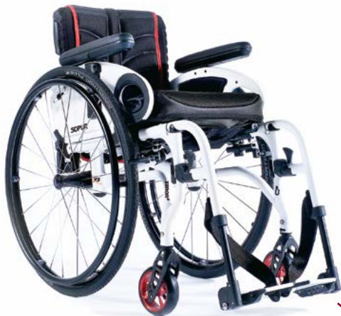
XENON ® SA DER ALLROUNDER