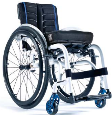
XENON ® HYBRID DER STÄRKSTE