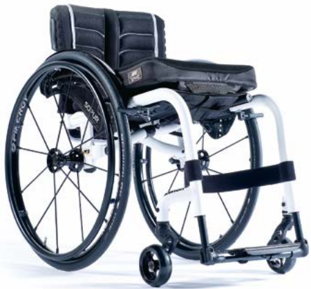
XENON ® FF DER LEICHTESTE