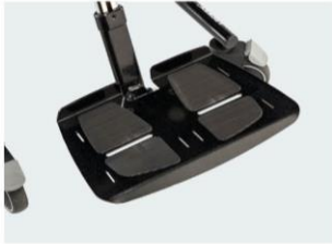
Patim único metal Tamanhos 1 e 2