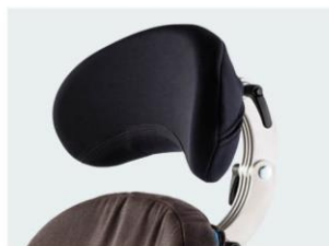
Apoio de cabeça com contorno tamanhos 1 e 2