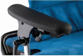
Apoio de braços