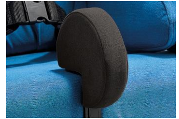
Taco abdutor em forma de disco