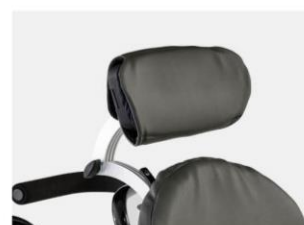
Apoio de cabeça plano Tamanho 1 e 2 cinza ébano