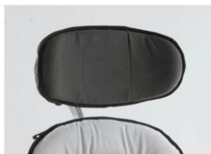
Apoio de cabeça com contorno Tamanho 3