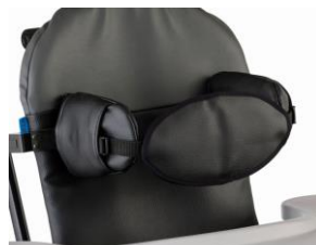
Arnês peitoral tamanhos 1 e 2