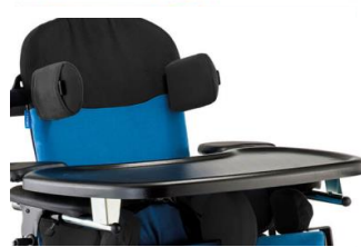
Mesa em plástico (preta)