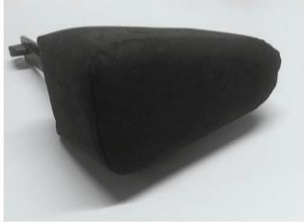
Taco abdutor em cunha