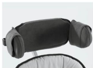
Apoio de cabeça plano Tamanho 1 e 2 vinil cinza