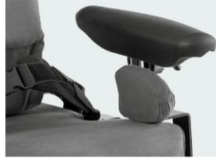
Placas de anca em adução