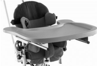
Mesa em plástico (cinza)