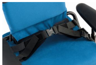
Cinto pélvico de 4 pontos