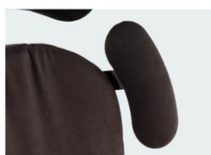
Placas de protração