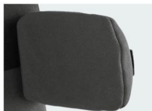
Placas torácicas fixas de PU