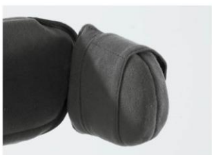
Laterais apoio de cabeça plano