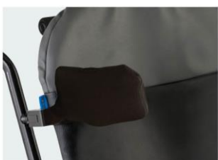
Placas torácicas articuladas