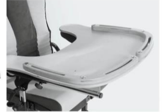
Mesa de terapia em madeira