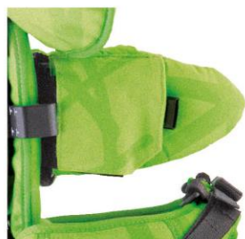
Soporte laterales abatibles