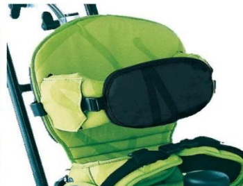
Soporte para esternón