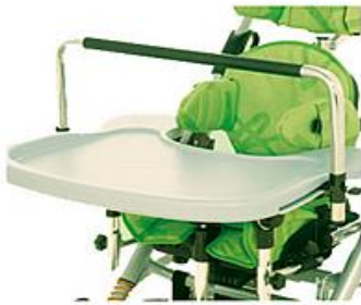
Barra de actividades para bandeja