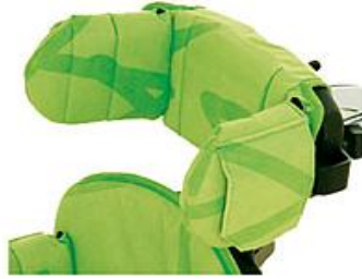
Soportes laterales rep. plano