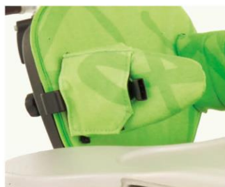
Soportes laterales fijos