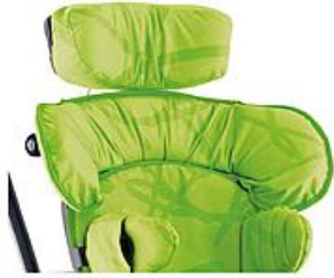
Soporte de hombros