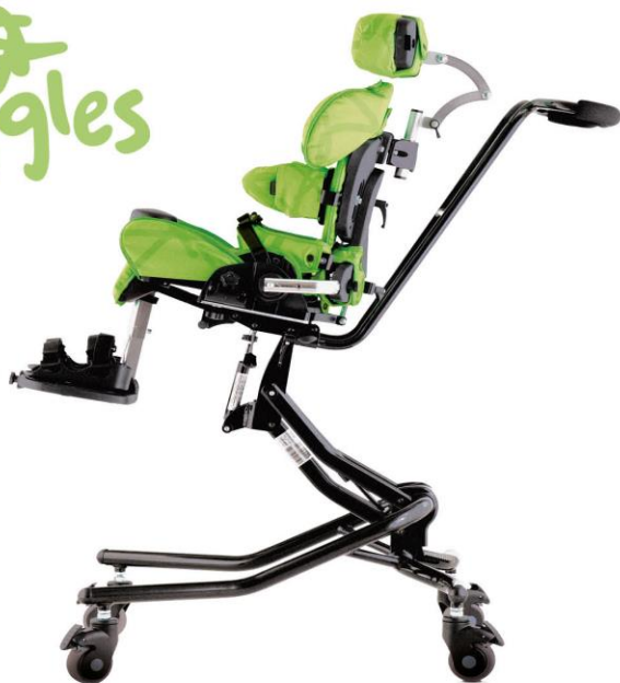
Base Hi Low con asa de empuje