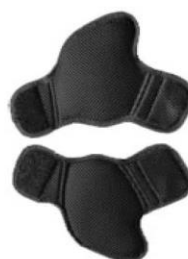
Reductor para cinturón pélvico