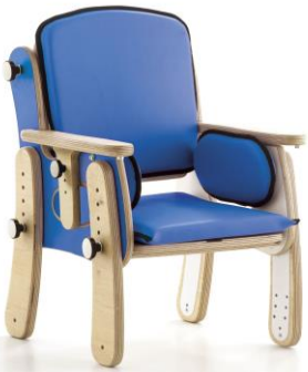
Base con patas