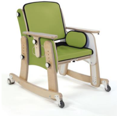
Base con Ruedas