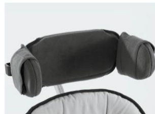
Reposacabezas plano Talla 1 y 2 vinilo gris