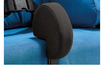
Cuña abductora disco