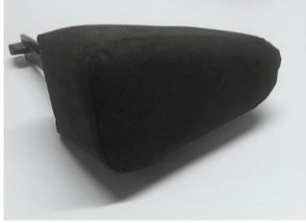
Cuña Abductora Taco