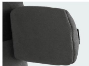
Soportes laterales fijos PU