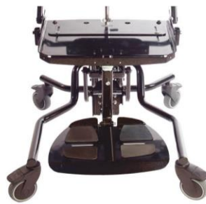
Chasis Hi Low