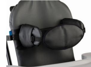
Soporte anterior torácico Tallas 1 y 2