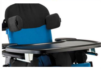
Bandeja plástico (negra)