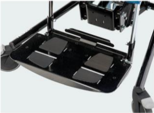
Plataforma metálica Talla 3