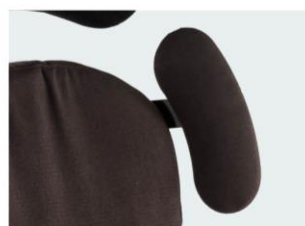
Soportes laterales protractores