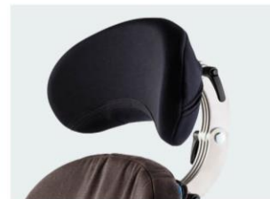
Reposacabezas contorneado tallas 1 y 2