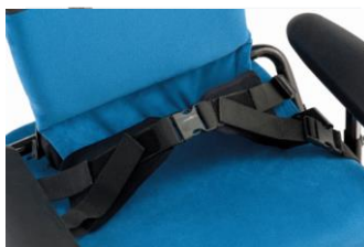
Cinturón pélvico de 4 puntos