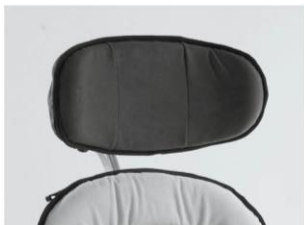
Reposacabezas contorneado Talla 3