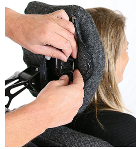
Apoio de cabeça Comfort