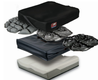
Almofada Jay Balance