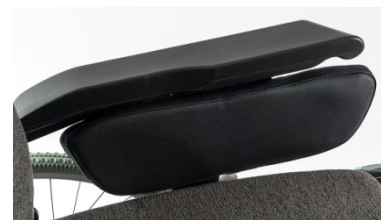
Capa protetora lateral acolchoada