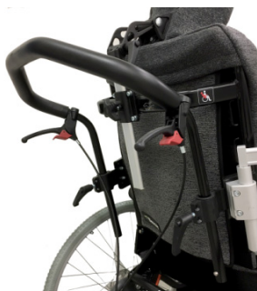
Barra de empurrar única