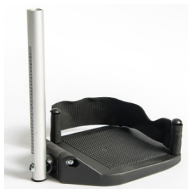
Plataformas em composite