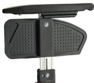
Apoio de braços standard