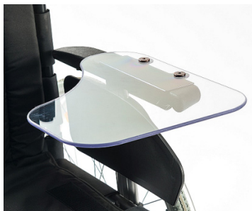
Mesa colocada num dos apoios de braço