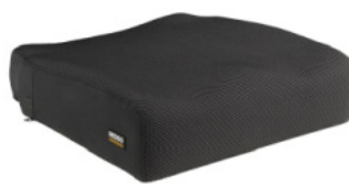
Almofada Sedeo Pro com suporte