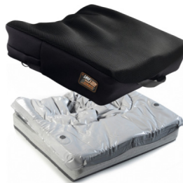
Almofada Jay 2 Profundo