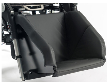
Caixa de apoio de pés