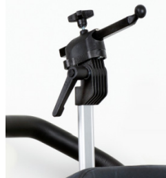
Fixação Apoio de cabeça Whitmyer