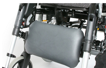
Almofada única para a barriga da perna