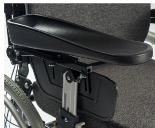
Apoio de braço para hemiplegicos