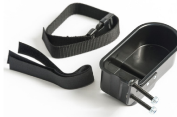
Suporte de canadianas