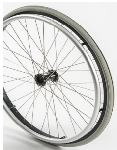
Rodas de 36 raios