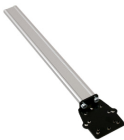
Fixação universal para apoio de cabeça