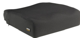
Almofada Sedeo Pro com suporte e memória