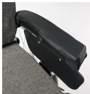
Capa acolchoada para almofada