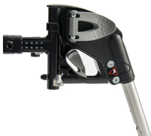
Apoios de pés em alumínio, eleváveis