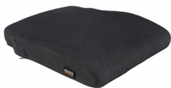
Almofada Sedeo Pro