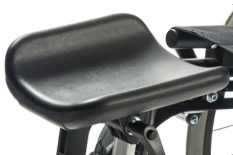
Suporte para amputados