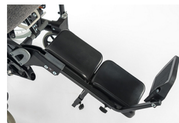
Suporte para engessado