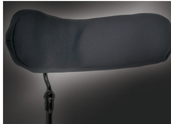
Apoio de cabeça Whitmyer