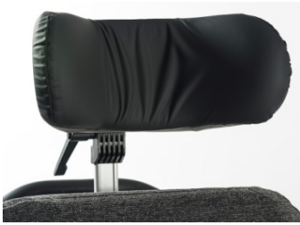
Apoio de cabeça standard