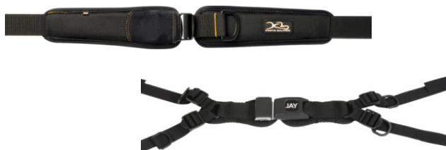
Cintos de posicionamento Jay