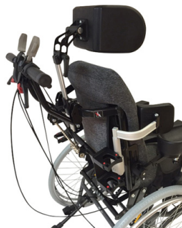
Barra ajustável em ângulo