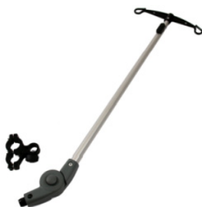
Suporte para soro