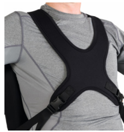
Peitoral Clássico dinâmico