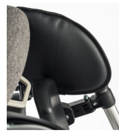
Protetor dos joelhos