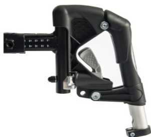
Apoios de pés em alumínio, não eleváveis