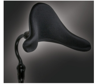
Apoio de cabeça Whitmyer