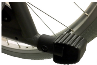
Tubos de cola