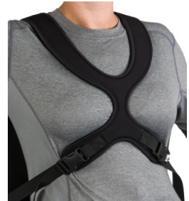
Peitoral Contour dinâmico