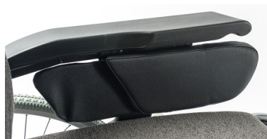
Capa protetora lateral com metade acolchoada