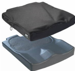
Almofada Jay Easy Visco