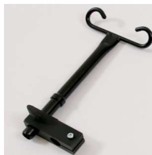
Suporte para garrafas de oxigénio