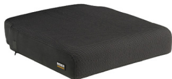
Almofada Sedeo Pro com estabilidade