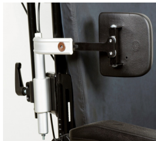
Suporte torácico ajustável em profundidade