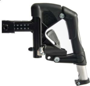
Reposapiés de aluminio