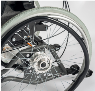
Ruedas con frenos de tambor