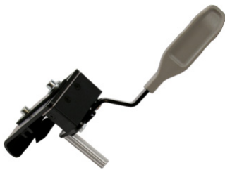
Freno de empuje