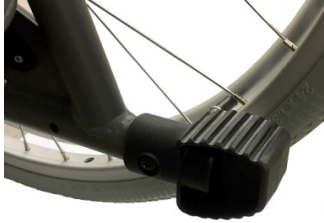
Tubos de cola