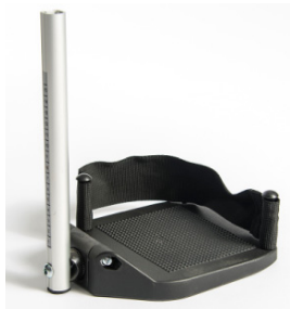
Plataformas de composite