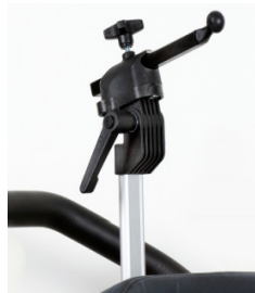
Montaje Reposacabezas Whitmyer