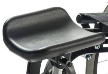
Soporte de amputado