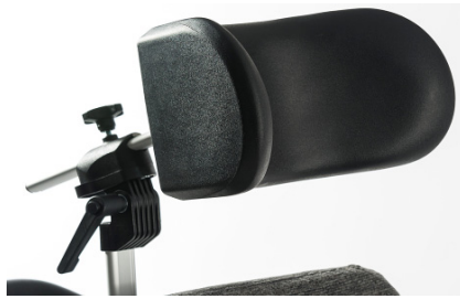
Reposacabezas con soportes laterales