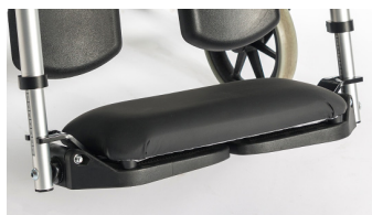
Almohadilla para plataformas