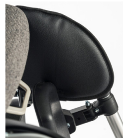
Protección para rodilla