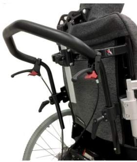
Asa de empuje única