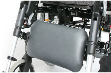
Almohadilla única para pantorrillas