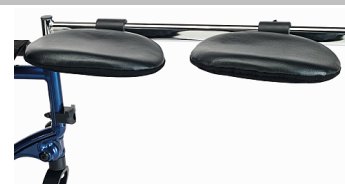
Suporte de gesso