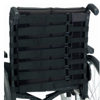
Tecido de nylon 7 correias