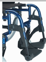
Apoios de pés a 80°