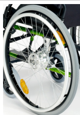
Rodas maciças com freno tambor