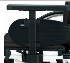
Em forma de T, ajustáveis manualmente