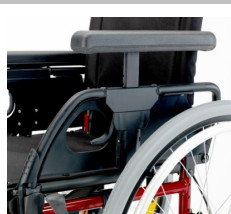
Apoio de braços regulável em altura manualmente