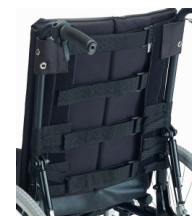
Tecido de nylon 4 correias