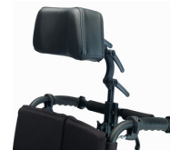
Apoio de cabeça de skay