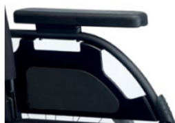
Apoios de braços de escritório