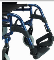
Apoios de pés a 70°