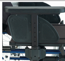
Em forma de T, ajustáveis em altura com ferramentas