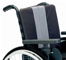
Tecido respirável vented