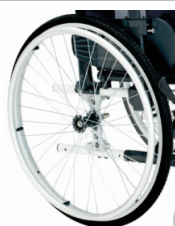
Rodas maciças com pneus pretas