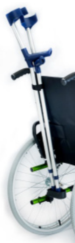
Soporte de bastones