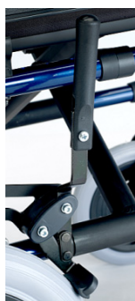
Alargador de freno