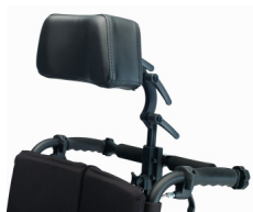
Reposacabezas de skay