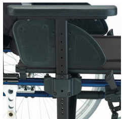
En forma de T