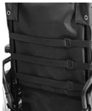
Tapicería nylon 3 cinchas