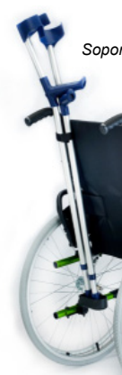
Soporte de bastones