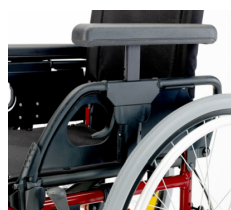
Ajustable en altura manualmente