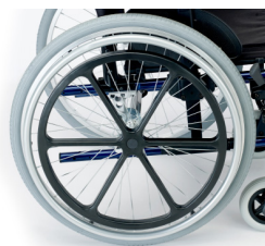
Ruedas con sistema de himpleja