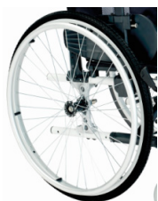
Ruedas macizas con cubiertas negras