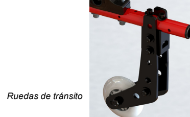
Ruedas de tránsito