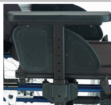
En forma de T, ajustables c/herramientas