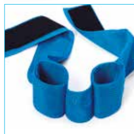
Cintura per abduzione