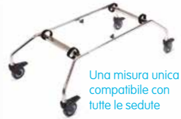
Advance Bath Chair