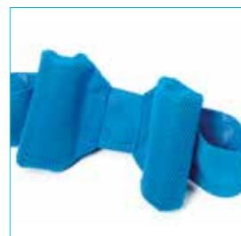
Appoggiatesta a contenimento laterale