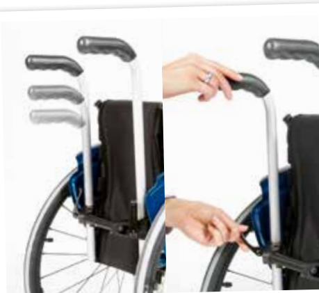
Höjdställbara körhandtag som är lätta att justera.