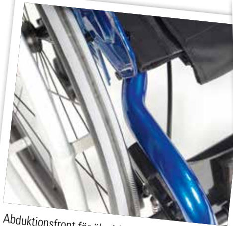
Abduktionsfront för ökad frihet att röra sig (tillval).

Simba är en rullstol som ger komfort och stabilitet och är mycket lättkörd.