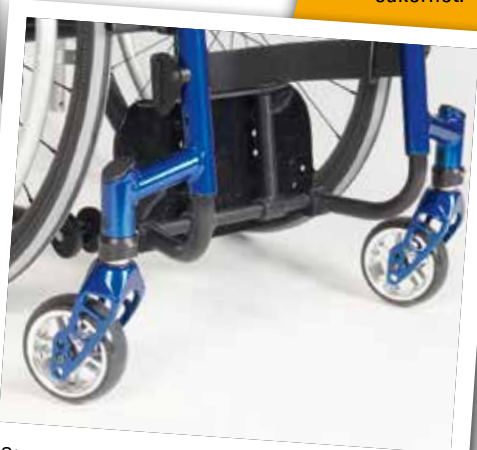
Stort uppfällbart fotstöd för mer ben-utrymme och lättare förflyttning (tillval),