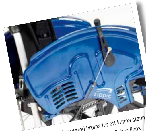
Safari sidoskyddmonterad broms för att kunna stanna snabbt och säkert. Vårdarbroms för föräldrar finns som tillval.