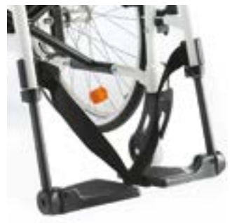
// LEC050020 Fußbrett geteilt Kunststoff, winkelverstellbar