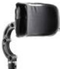
// LEC030410 Kopfstütze, groß, höhen- / tiefen- / winkelverstellbar, 23 x 11 cm