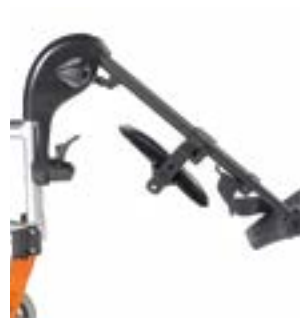
// LEC050009, LEC050010, LEC050011 Fußbretthalter hochschwenkbar (ELR)