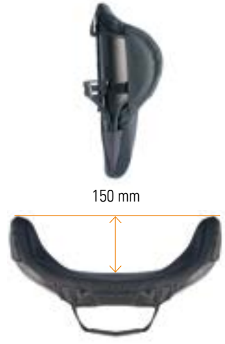
// Mittlere Tiefe Kontur (MDC /XMDC)