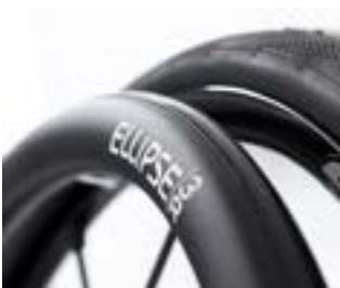
// LEC070212 Ellipse 3R