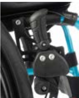
// LEC060002 Kniehebelbremse