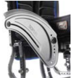
// LEC040103 Aluminium, Kleider- schutz, Kälteschutz