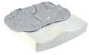
// JAY020007 JAY Easy Fluid Kissen (Bild zeigt Kissen ohne Bezug)