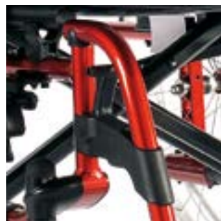
// LEC050003, LEC050004, LEC050005 Fußbretthalter Kunststoff 100°