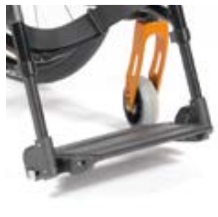
// LEC050023 Fußbrett durchgehend Aluminium