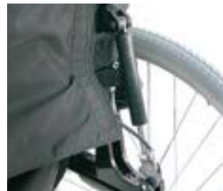
// LEC030014 Gasdruckfeder, Schiebegriffe lang (0° - 30°)