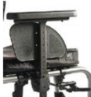
// LEC040052 Seitenteil Zentral- stütze, Arm- polster, tiefen- und höhenverstellbar