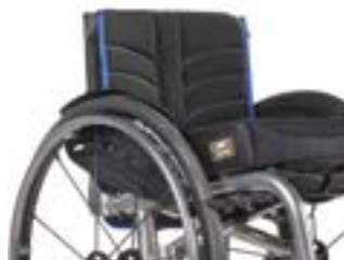
// LEC030317 EXO PRO Rückenbespannung (Exo Evo Version)