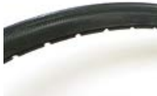
// LEC070102 Bereifung, pannensicher