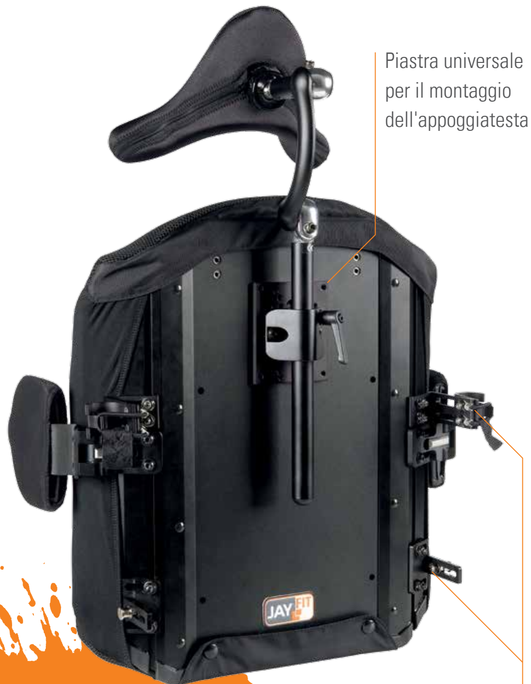
Piastra universale per il montaggio dell'appoggiatesta