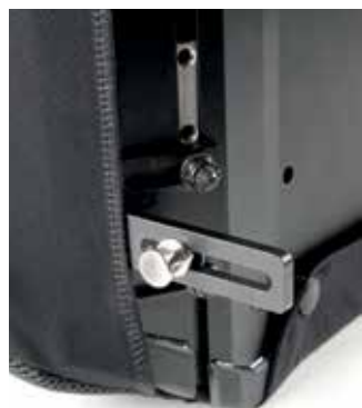
// SUPPORTI INFERIORI

// Certificato per il trasporto in auto.