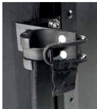
// SISTEMA DI AGGANCIO SNAPTITE