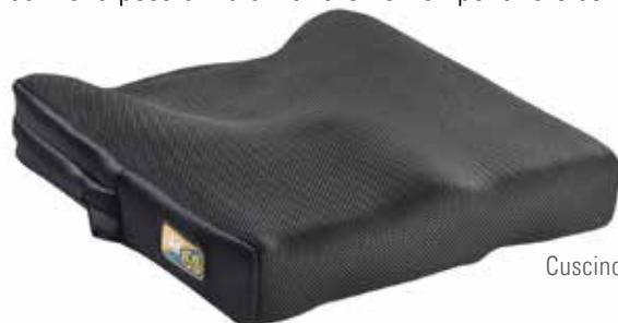
Cuscino JAY GS

La combinazione schienale JAY Fit e cuscino JAY GS rappresenta una soluzione ideale per realizzare posizionamenti complessi sia di utenti adulti che di utenti pediatrici. Grazie alla loro modularità lo schienale Jay Fit ed il cuscino JAY GS danno la possibilità di variare nel tempo la loro configurazione per essere sempre efficaci e confortevoli.