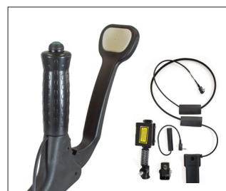
// 71009406 & 71009408 Kit Parkinson per Gemino Walker