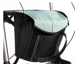
// 9012317 (1) Advanced, Verde menta/Nero