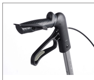
// 9012281 (5) Kit maniglia di spinta allungata e graduata