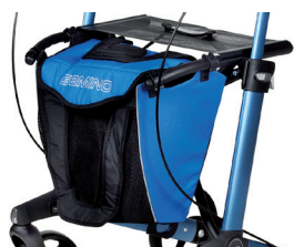
// 7104022 (1) Advanced con maniglia e tracolla, in colore Blu/ Nero