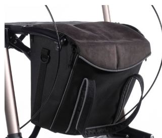
// 9012315 (1) Advanced, Alcantara/Nero