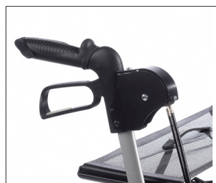
// 9012049 & 9012063 Freno azionabile con una sola mano