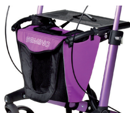
// 7104023 (1) Advanced con maniglia e tracolla, in colore Rosa/ Nero