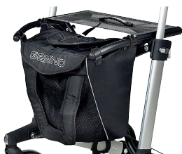
// 7104007 Advanced con maniglia e tracolla, in colore Nero