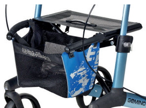
// 7104032 Blu/Nero stampato