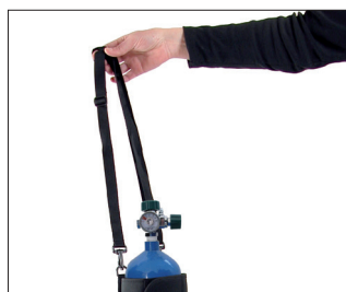
// 7109050 & 7109051 Sacca e cintura porta bombola d'ossigeno