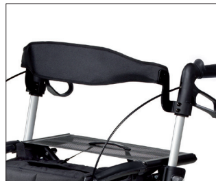
// 9012220 & 9012221 (3) (4) Supporto per la schiena