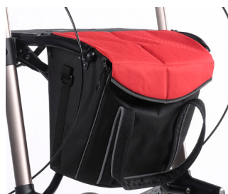
// 9012318 (1) Advanced, Rosso/Nero