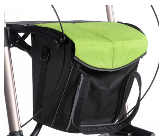
// 9012320 (1) Advanced, Verde/Nero