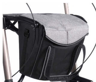
// 9012316 (1) Advanced, Grigio grafite/Nero