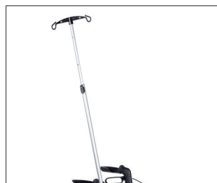
// 7109100 Asta portaflebo