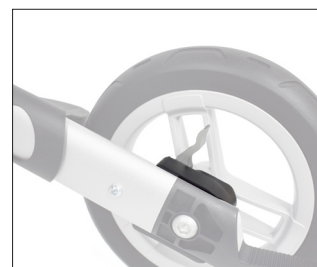
// 7109080 (6) & 7169080 (6) Sistema di rallentamento delle ruote posteriori