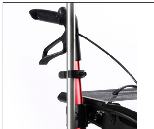
// 7109011 Portastampella