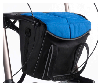
// 9012319 (1) Advanced, Blu/Nero