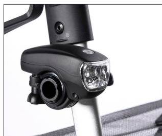
// 7109095 Luce applicata al telaio