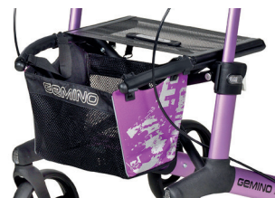
// 7104033 Rosa/Nero stampato