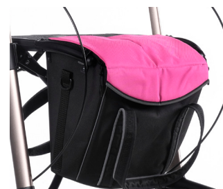
// 9012321 (1) Advanced, Rosa/Nero