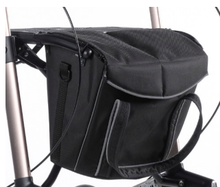
// 9012314 (1) Advanced, Nero/Nero