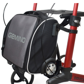
// 9012369 (2) Borsa Trolley Shop-n-Go