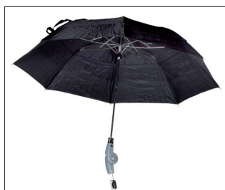
// 7109060 Ombrellino