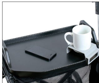
// 7109140 Tavolino