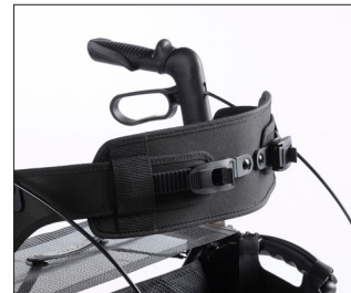
// 9012222 (4) Supporto "comfort" regolabile per la schiena