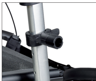
// 7109090 Gancio universale