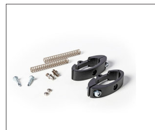
// 9011971 (7) Kit freni ad azione inversa