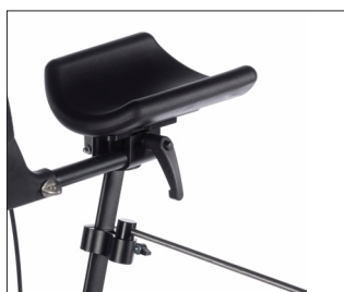
// 9011992 & 9011988 Barra stabilizzatrice