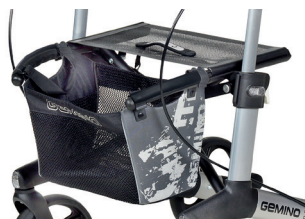
// 7104035 Grigio/Nero stampato