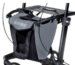
// 7104025 (1) Advanced con maniglia e tracolla, in colore Grigio/ Nero