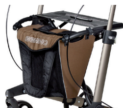
// 7104024 (1) Advanced con maniglia e tracolla, in colore Marrone/Nero