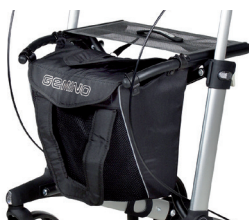
// 7104006 (1) Advanced con maniglia e tracolla, in colore Nero