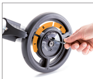
// 9009329 (8) Speedcontrol