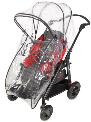
Capa para la lluvia transparente