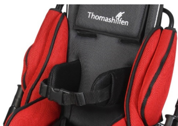
Soportes de tronco con cinturón