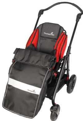
Saco de verano