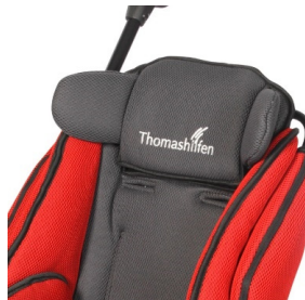
Soportes de cabeza 45° flexibles