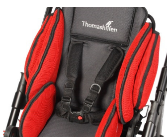
Cinturón en H