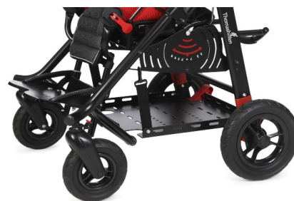
Bandeja para sistemas ventilatorios