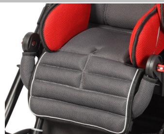
Soporte de rodillas para el reposapiés