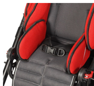
Cinturón pélvico de 2 puntos