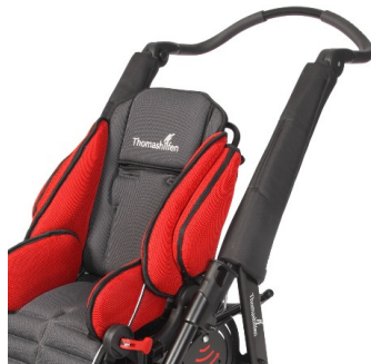
Protectores de tubo