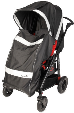
Saco con capota cuerpo entero