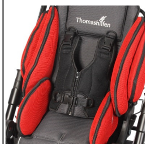
Chaleco de seguridad