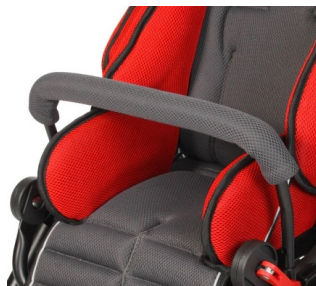
Barra protectora curva reforzada