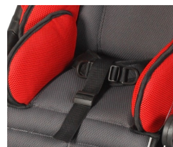
Cinturón de 2 puntos con cincha entrepierna