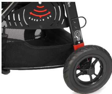
Anclajes para el transporte en vehículos