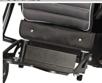
Soporte para pantorrillas