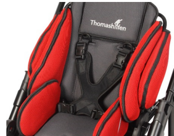
Peto mariposa dinámico de neopreno