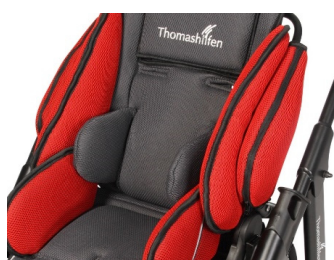
Soportes de tronco