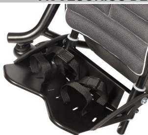
Cinchas para los pies