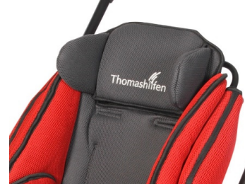
Soportes de cabeza