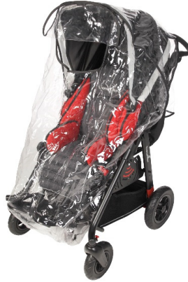
Funda completa lluvia transparente