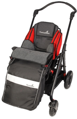
Saco de invierno