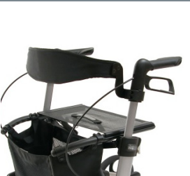
// 7109020 & 7109021 Encosto (2) (3)