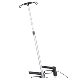
// 7109100 Suporte de soro