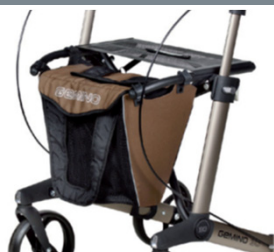
// 7104024 (1) Castanha / preta