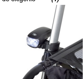
// 7109095 Luz