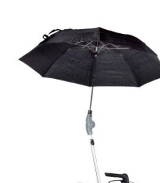
// 7109060 Chapéu de Chuva em preto