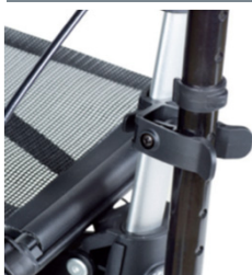
// 7109011 Suporte de canadianas