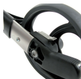
// 7109080 Travão de desaceleração