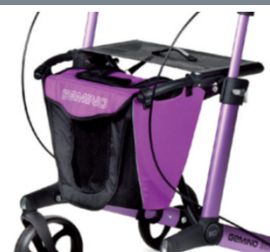
// 7104023 (1) Violeta/preta