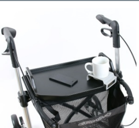
// 7109140 Mesa -bandeja