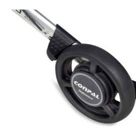
// 9009329 (2) Rodas SpeedControl

(1) Não disponível para Geminos 60 M/60 M Walker. (2) Não disponível para Geminos 60 / 60 M e Gemino 60 Walker/60 M Walker.