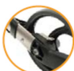
Slow down brake