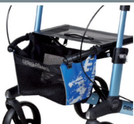
// 7104032 Bolsa estampada azul/preto