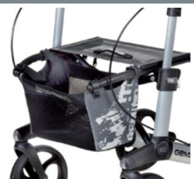
// 7104035 Bolsa estampada cinz./preta