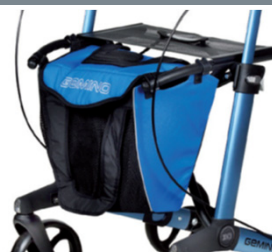
// 7104022 (1) Azul/preta