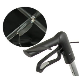
// 7109071 (2) Travão de uma só mão