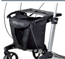
// 7104006 (1) & 7104007 Bolsa Advance com tampa e pegas preta