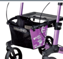
// 7104033 Bolsa estampada violeta/preto