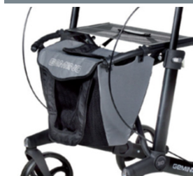
// 7104025 (1) Cinzenta / preta