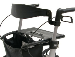
// 7109020 & 7109021 Encosto (2) (3)