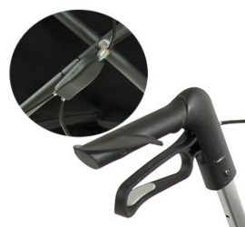
// 7109071 (2) Travão de uma só mão