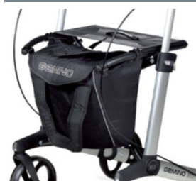
// 7104006 (1) & 7104007 Bolsa Advance com tampa e pegas preta