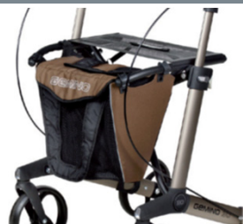
// 7104024 (1) Castanha / preta