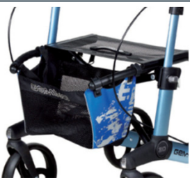
// 7104032 Bolsa estampada azul/preto