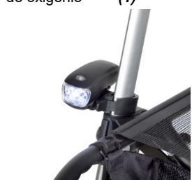
// 7109095 Luz