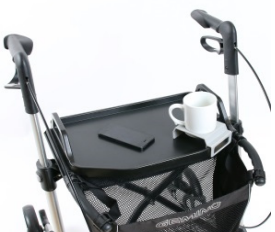
// 7109140 Mesa -bandeja