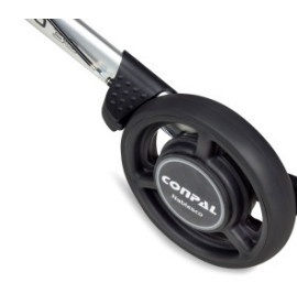
// 9009329 (2) Rodas SpeedControl

(1) Não disponível para Geminos 60 M/60 M Walker. (2) Não disponível para Geminos 60 / 60 M e Gemino 60 Walker/60 M Walker.