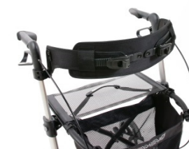
// 7109035 (3) Encosto ajustável confort