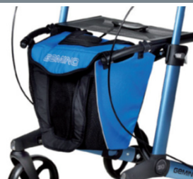
// 7104022 (1) Azul/preta