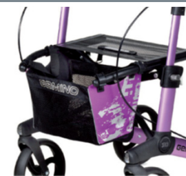
// 7104033 Bolsa estampada violeta/preto