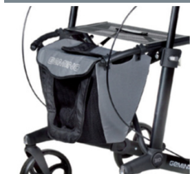
// 7104025 (1) Cinzenta / preta