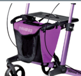
// 7104023 (1) Violeta/preta