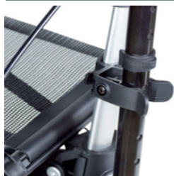
// 7109011 Suporte de canadianas