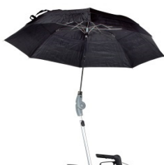
// 7109060 Chapéu de Chuva em preto