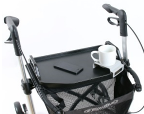
// 7109140 Mesa -bandeja