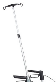
// 7109100 Suporte de soro