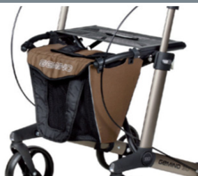
// 7104024 (1) Castanha / preta