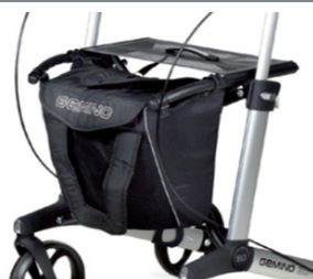
// 7104006 (1) & 7104007 Bolsa Advance com tampa e pegas preta