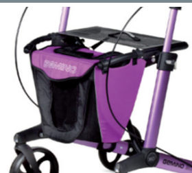
// 7104023 (1) Violeta/preta