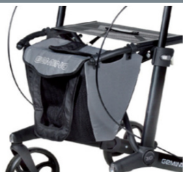
// 7104025 (1) Cinzenta / preta