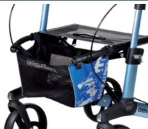
// 7104032 Bolsa estampada azul/preto