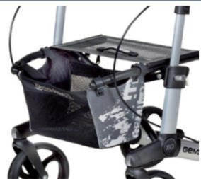
// 7104035 Bolsa estampada cinz./preta