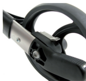
// 7109080 Travão de desaceleração