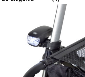
// 7109095 Luz