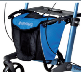
// 7104022 (1) Azul/preta