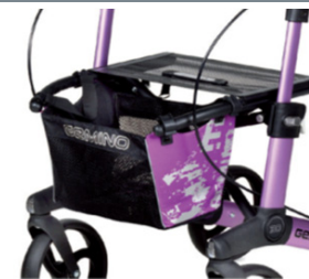
// 7104033 Bolsa estampada violeta/preto