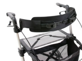
// 7109035 (3) Encosto ajustável confort