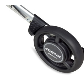
// 9009329 (2) Rodas SpeedControl

(1) Não disponível para Geminos 60 M/60 M Walker. (2) Não disponível para Geminos 60 / 60 M e Gemino 60 Walker/60 M Walker.