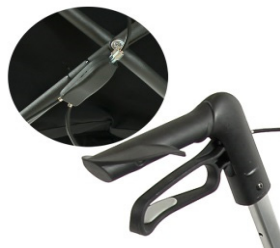
// 7109071 (2) Travão de uma só mão