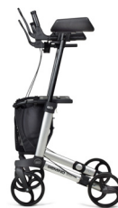
GEMINO 30 walker