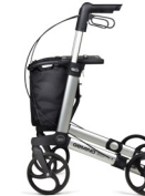
GEMINO 30 parkinson

En caso de aceleración repentina, el sistema SpeedControl aumenta la resistencia de las ruedas para evitar caídas.