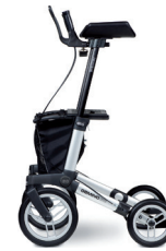
GEMINO 60 walker

Soportes de antebrazo ajustables para mayor estabilidad.