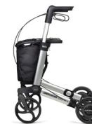
GEMINO 30 SpeedControl