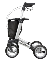
GEMINO 30 comfort

Disponible en 6 colores anodizados. Amplia gama de accesorios.