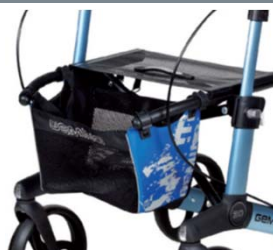
// 7104032 Bolsa estampada azul/negro