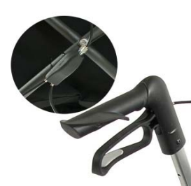
// 7109071 (2) Freno de una sola mano