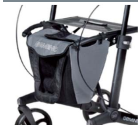
// 7104025 (1) Gris /negra