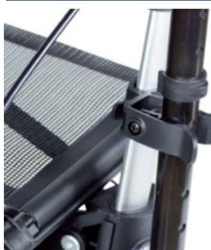
// 7109011 Soporte de bastones