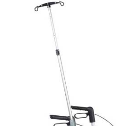
// 7109100 Soporte de gotero