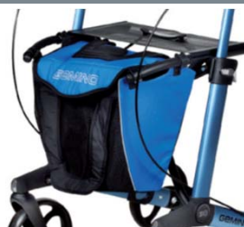
// 7104022 (1) Azul/negra