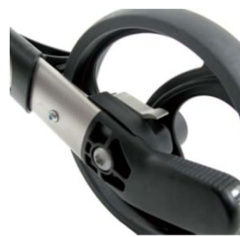
// 7109080 Freno de desaceleración