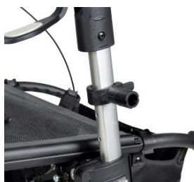
// 7109090 Abrazadera universal