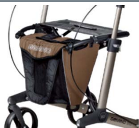
// 7104024 (1) Marrón/ negra