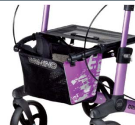
// 7104033 Bolsa estampada violeta/negro