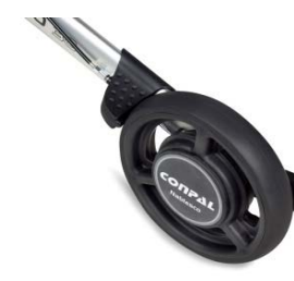
// 9009329 (2) Ruedas SpeedControl

(1) No disponible para Geminos 60 M/60 M Walker. (2) No disponible para Geminos 60 / 60 M y Gemino 60 Walker/60 M Walker.