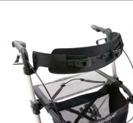
// 7109035 (3) Respaldo ajustable comfort