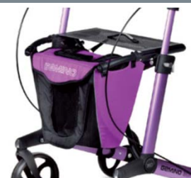
// 7104023 (1) Violeta/negra