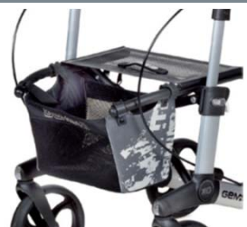
// 7104035 Bolsa estampada gris/negro