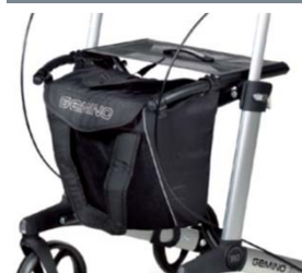
// 7104006 (1) & 7104007 Bolsa Advance con tapa y asas negra