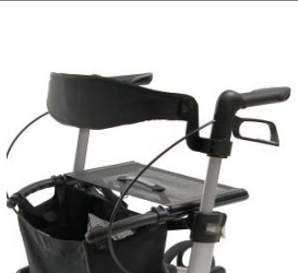
// 7109020 & 7109021 Respaldo (2) (3)