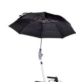
// 7109060 Paraguas, color negro