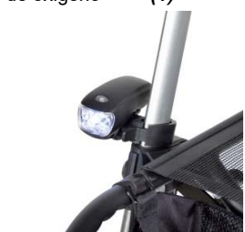
// 7109095 Luz