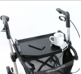
// 7109140 Mesa -bandeja