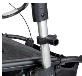
// 7109090 Abrazadera universal