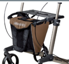
// 7104024 (1) Marrón/ negra