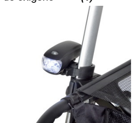
// 7109095 Luz