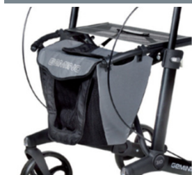
// 7104025 (1) Gris /negra