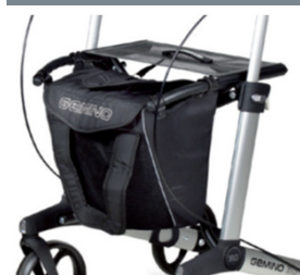
// 7104006 (1) & 7104007 Bolsa Advance con tapa y asas negra