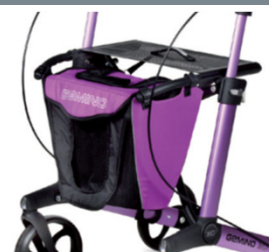
// 7104023 (1) Violeta/negra