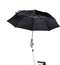
// 7109060 Paraguas, color negro