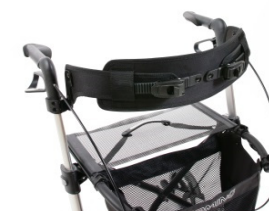
// 7109035 (3) Respaldo ajustable comfort