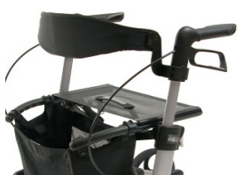
// 7109020 & 7109021 Respaldo (2) (3)