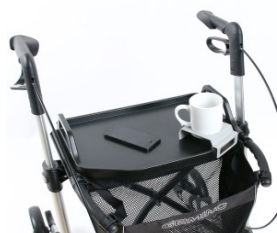
// 7109140 Mesa -bandeja