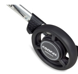
// 9009329 (2) Ruedas SpeedControl

(1) No disponible para Geminos 60 M/60 M Walker. (2) No disponible para Geminos 60 / 60 M y Gemino 60 Walker/60 M Walker.