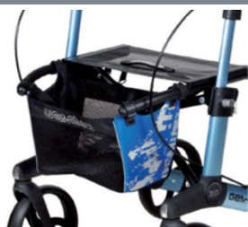
// 7104032 Bolsa estampada azul/negro