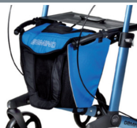
// 7104022 (1) Azul/negra