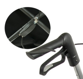
// 7109071 (2) Freno de una sola mano