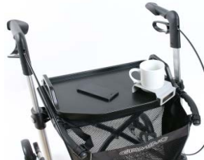
// 7109140 Mesa -bandeja