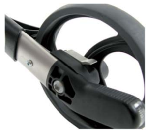
// 7109080 Freno de desaceleración