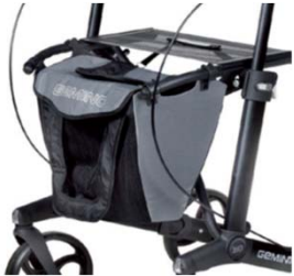
// 7104025 (1) Gris /negra