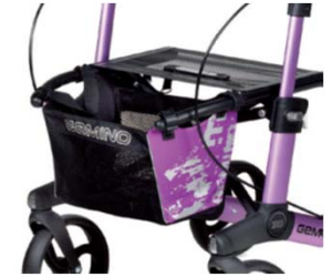
// 7104033 Bolsa estampada violeta/negro