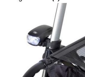
// 7109095 Luz