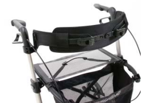
// 7109035 (3) Respaldo ajustable comfort