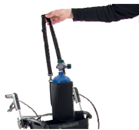
// 7109050 & 7109051 Soporte para bombonas de oxígeno (1)