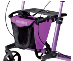
// 7104023 (1) Violeta/negra