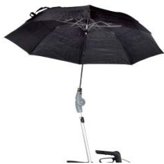
// 7109060 Paraguas, color negro