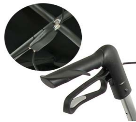
// 7109071 (2) Freno de una sola mano