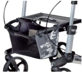
// 7104035 Bolsa estampada gris/negro