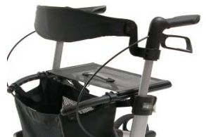
// 7109020 & 7109021 Respaldo (2) (3)