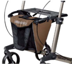
// 7104024 (1) Marrón/ negra