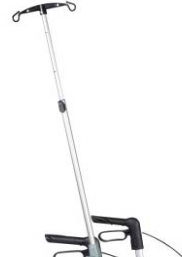
// 7109100 Soporte de gotero