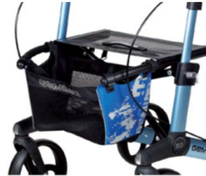
// 7104032 Bolsa estampada azul/negro