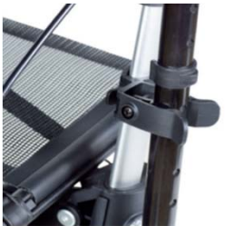
// 7109011 Soporte de bastones