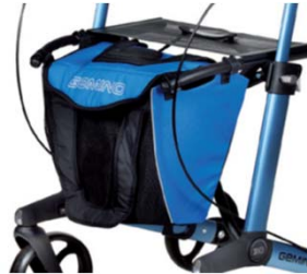
// 7104022 (1) Azul/negra