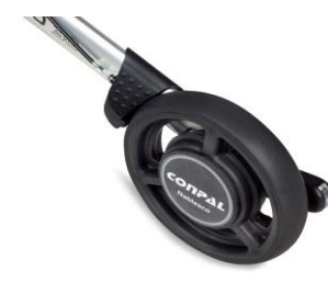
// 9009329 (2) Ruedas SpeedControl

(1) No disponible para Geminos 60 M/60 M Walker. (2) No disponible para Geminos 60 / 60 M y Gemino 60 Walker/60 M Walker.