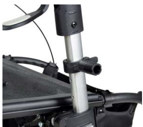
// 7109090 Abrazadera universal