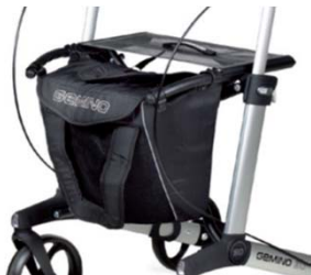
// 7104006 (1) & 7104007 Bolsa Advance con tapa y asas negra