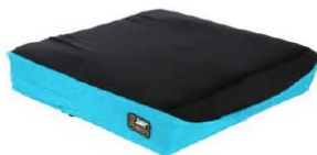
Fodera esterna con banda laterale Turchese