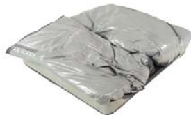
Sovrariempimento destro per obliquità pelvica