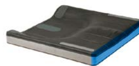
Riduzione della lunghezza