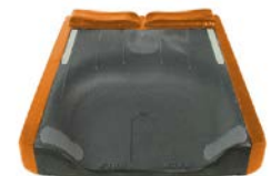
Incremento della larghezza e della lunghezza