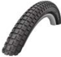
// ATT070110 Grobprofil, Mountainbike