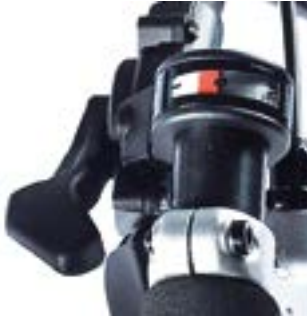
// ATT070045 Daumenschalter