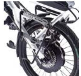
// ATT090082 Taschenhalter