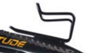
// ATT090081 Flaschenhalter