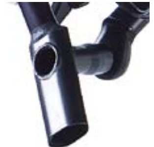
// ATT080025 Griff, vertikal, 25° Winkel, oval, Durchmesser 37 x 21 mm