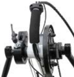
// ATT060051 Rücktrittbremse