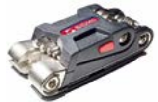
// ATT090041 Multifunktionswerkzeug