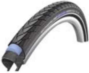
// ATT070104 Schwalbe Marathon Plus Evolution, pannengeschützt