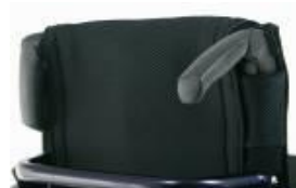
NSW030203 Składane rączki do prowadzenia