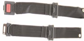
NSW090018 Pas stabilizujący z metalową kłamrą