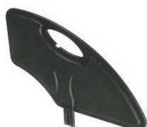
NSW040107 Kompozytowe, zdejmowane, czarne