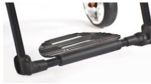
NSW050059 Platforma podnóżka typu Performance