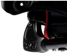
NSW030012 Oparcie z regulacją kąta