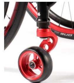
NSW080008 Widelce jednoramienny