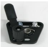
NSW060001 Hamulec standardowy