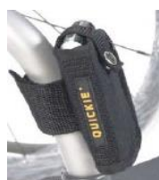
NSW090026 Kieszka na telefon komórkowy