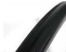
NSW070102 Opony odporne na przebiecia (pełne)