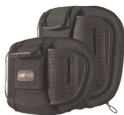
Oparcie Jay 3 karbonowe płytki kontur