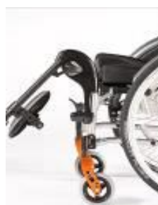
NSW050011 Aluminiowe, podnoszone (0- 90°), odchylane