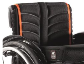
NSW030317 Tapicerka EXO PRO