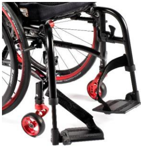
NSW050022 Dzielone platformy, aluminiowe, w kolorze ramy