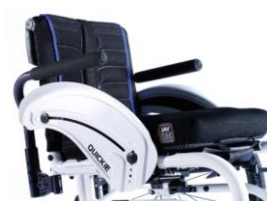
NSW040117 Podłokietniki rurowe, aluminiowe, odchylane (na bok), wyściełane, zdejmowane