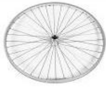
NSW070002 Koła z polerowaną piastą