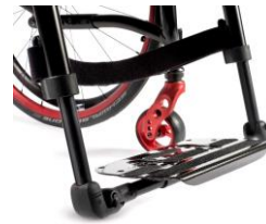
NSW050132 Lekka, karbonowa platforma podnóżka