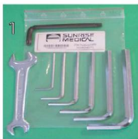
NSW090000 Zestaw narzędzi