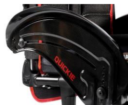
NSW040104 Z włókna węglowego, z błotnikiem, z ochroną ubrań, czarne