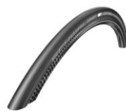
NSW070107 Opony Schwalbe One