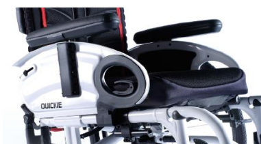
NSW04000x Podłokietniki stołkowe, z poduszką, unoszone do góry, zdejmowane