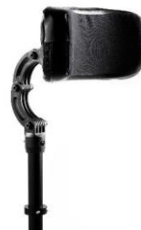
NSW030412 Zagłówek, średni