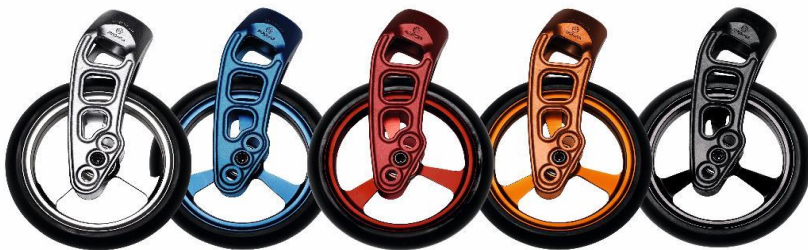
NSW080013 & NSW080306 Widelce Carbotechnology i aluminiowe