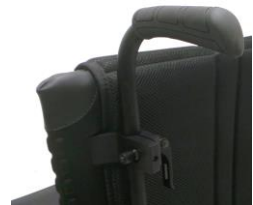
NSW030204 Rączki do prowadzenia z regulacją wysokości