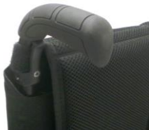
NSW030201 Rączki do prowadzenia z długą rękkojeścią