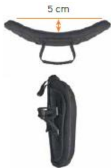
Oparcie Jay 3 p płytki kontur