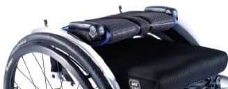
NSW030031 Oparcie składane