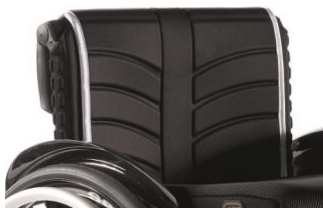
NSW030316 Tapicerka EXO