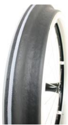
NSW070208 Ciągi Maxgrepp