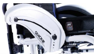
NSW040103 Aluminiowe, z błotnikiem, z ochroną ubrań, w kolorze ramy wózka