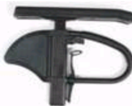
NSW040050 Podłokietnik jednostopkowy