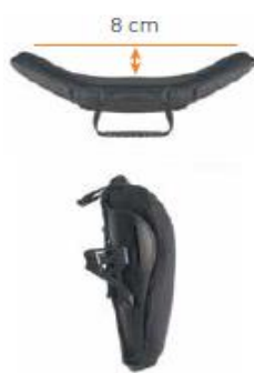
Oparcie Jay 3 średni kontur