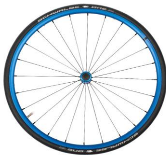
NSW100337 Koło lekkie, anodowane, niebieskie