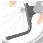
NSW090001 System wspomagający przy przechylaniu