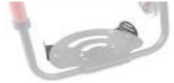
NSW050127 Płytki pozycjonujące stopy