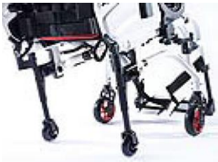
NSW090010 Koła tranzytowe