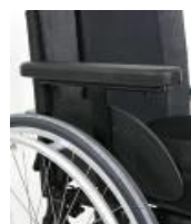
NSW040052 Jednostopkowy podłokietnik z regulacją wysokości i głębokości, z poduszką (33 cm)