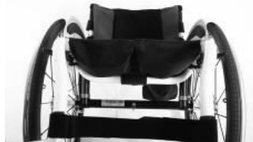
NSW020003 Tapicerka siedziska z 2 kieszeniami