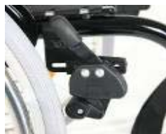
XES060002 Travão de joelho (montado alto)