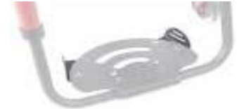
XES050127 Posicionadores de pés