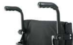
XES 030204 Punhos ajustáveis em altura