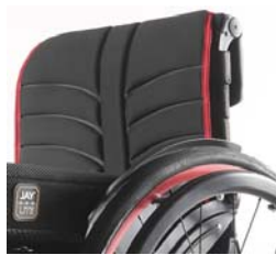
XES 030316 Tecido do encosto EXO EVO