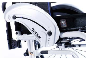
XES040103 Protector lateral de alumínio com guarda lamas