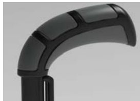
XES 030201 Punhos standard largos