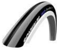
XES070101 Pneus Alta pressão lisa Right Run