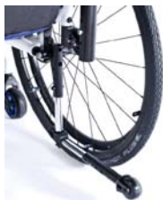
XES090004 Rodas antivoltio rebativeis