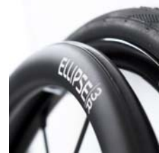
XES070212 Ellipse 3R