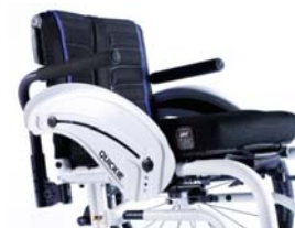
XES040117 Reposabrazos tubulares acolchados