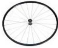
XES070003 Rodas traseiras ligeiras