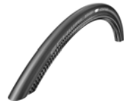
XES070107 Pneus Schwalbe One