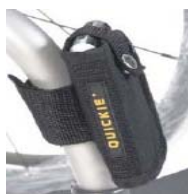
XES090026 Suporte telemóvel