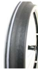
XES070208 Aros Maxgrepp