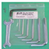
XES090000 Kit de ferramentas