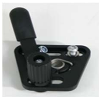
XES060001 Travão standard