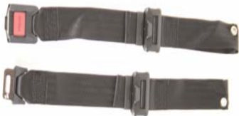
XES 090018 Cinto de posicionamento com fecho