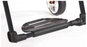
XES050059 Plataforma Xenon Performance