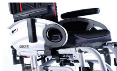
XES04000x Apoios de braço de escritório