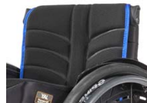
XES 030317 Tecido do encosto EXO EVO PRO