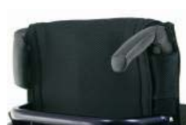
XES 030203 Punhos dobráveis