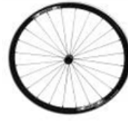
XES07000 Rodas Proton (ultraligeiras)