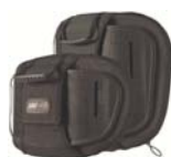
Torácico Inferior (LT)