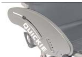
XES040102 Protector lateral de alumínio sem guarda lamas