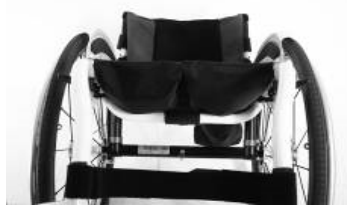
XES 020003 T Tecido do assento com 2 bolsas