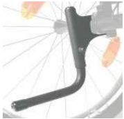
XES090001 Ajuda p/subir passeio