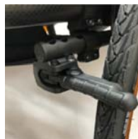
XES060023 Travão compacto EVO