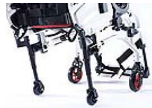
XES090010 Rodas de trânsito