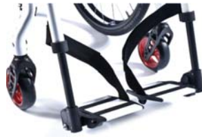
XES050022 Apoio de pés divididos de alumínio, na cor da estrutura