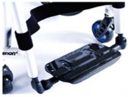
XES050132 Plataforma única de fibra de carbono