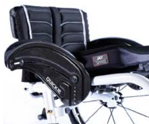
XES040104 Protector lateral de carbono com guarda lamas