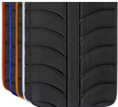
Cor dos rebordos tecidos EXO EVO