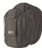
Torácico Medio (MT)