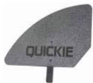
XES040107 Protector de plástico desmontável