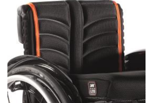
XFF 030317 tapicerka siedziska EXO PRO