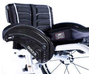
XES040104 Błotnik z włókna węglowego, z ochroną ubrań