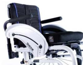
XES040117 Podłokietnik rurowy, odchylany, zdejmowany, wyścielany