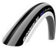
XES070101 Schwalbe Right Run