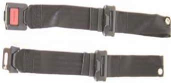
XFF 090018 Pas stabilizujący z metalową klamrą