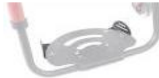
XES050127 Płytki pozycjonujące stopy