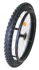
XES07010 Koto górskie