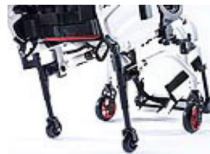
XES090010 Kółka tranzytowe