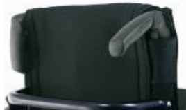
XFF 030203 Składane rączki do prowadzenia