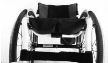
XFF 020003 tapicerka siedziska z 2 kieszeniami