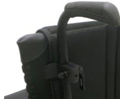
XFF 030204 Rączki do prowadzenia z regulacją wysokości