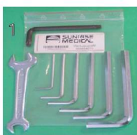
XES090000 Zestaw narzędzi