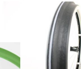
XES070208 Ciągi Maxgrepp