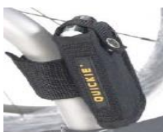
XES090026 Kieszek na telefon komórkowy