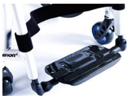
XES050132 Lekka platforma podnóżka z włókna węglowego