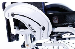
XES040103 Aluminiowa z ochroną ubrań