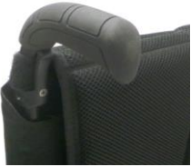
XFF 030201 Rączki do prowadzenia z długą rękojeścią