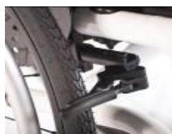
XES060003 Hamulec kompaktowy