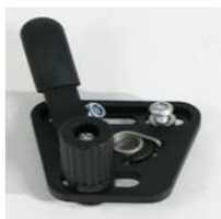
XES060001 Hamulec standardowy