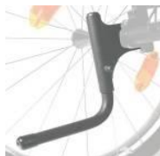
XES090001 Rurka wspomagająca przy przechylaniu