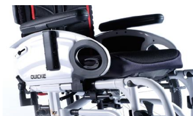
XES04000x Podłokietnik stolikowy, z poduszką, odchylany do góry, zdejmowany