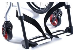
XES050022 Platforma podnóżka dzielona, odchylana, w kolorze ramy