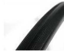
XES070102 Opona odporna na przebicia (pełna)