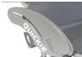
XES040102 Wąska osłona z włókna węglowego z ochroną ubrań