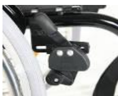
XES060002 Dźwignia blokady hamulca na wysokości kolan