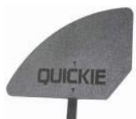
XES040107 Kompozytowa osłona boczka, odpinana