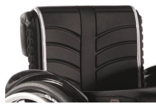
XFF 030316 tapicerka siedziska EXO