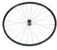
XFF070003 Superleggera a 24 raggi dritti