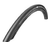
XFF070107 Schwalbe One, pneumatici, lisci