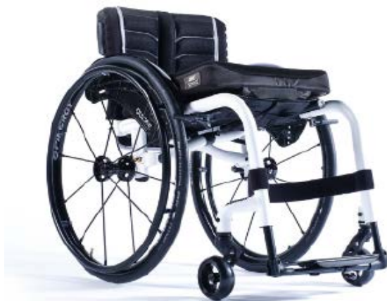
XFF010012 / 13 Telaio Standard