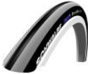
XFF070101 Schwalbe Right Run, pneumatici, fine profile