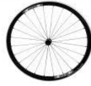
XFF070004 Proton a 24 raggi dritti neri