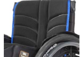
XFF 030317 Telo schienale nero EXO EVO PRO, imbottito, regolabile, traspirante con 2 tasche