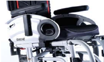
XFF04000x Braccioli estraibili, ribaltabili con imbottiture