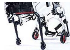
XFF090010 Ruotine da transito