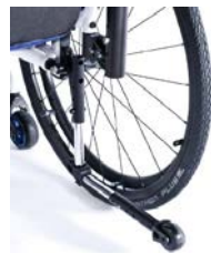
XFF090004/5/6 Ruotine antibaltamento Swing Away SX/DX/paio