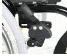
XFF060002 Freno a leva dritta