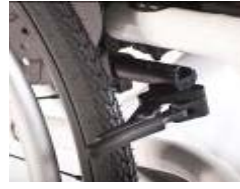
XFF060003 Compact brake