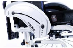
XFF040103 Spondine diritte in alluminio nel colore del telaio con bordo avvolgente