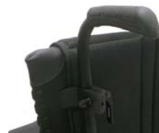
XFF 030204 Maniglie di spinta regolabili in altezza