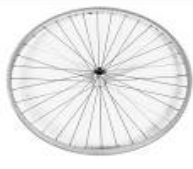
XFF070002 A raggi dritti con mozzo Design (36 raggi col. grigio argento)