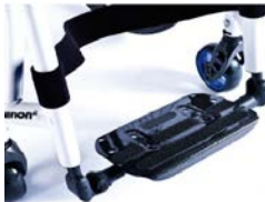
XFF050132 Pedana unica regolabile in angolazione con appoggiapiedi in fibra di carbonio, regolabile in angolazione e profondità, ribaltabile lateralmente con cinghia fermapolpacci