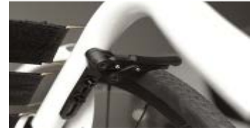
XFF060004 Freno a forbice compatto superleggero