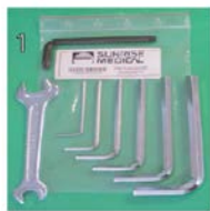
XFF090000 Kit di chiavi