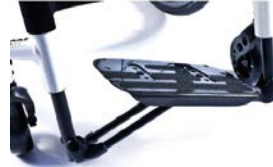
XFF050027 Pedana con chiusura a libro automatica, regolabile in angolazione e profondità con appoggiapiedi in fibra di carbonio, con cinghia fermapolpacci