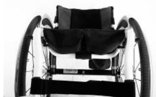
XFF 020003 Telo seduta a tensione regolabile con 2 tasche