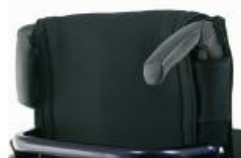
XFF 030203 Maniglie di spinta pieghevoli in materiale composito