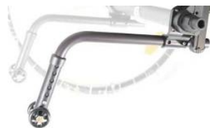
XFF090050 Ruotine antibaltamento inseribili