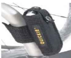
XFF090026 Porta cellulare