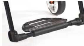
XFF050059 Pedana unica regolabile in angolazione con appoggiapiedi in alluminio performance, regolabile in angolazione, ribaltabile lateralmente con cinghia fermapolpacci