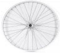
XFF070001 A raggi incrociati con mozzo. Universal (36 raggi col. grigio argento)