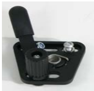
XFF060001 Freno a leva corta