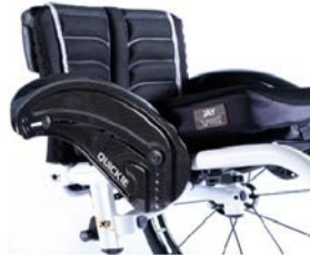
XFF040104 Spondine diritte in fibra di carbonio nere con bordo avvolgente