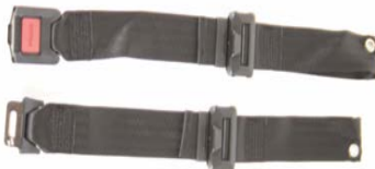
XFF 090018 Cintura pelvica con aggancio