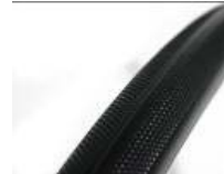
XFF070102 Antiforatura, con battistrada