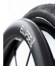
XFF070212 Ellipse 3R