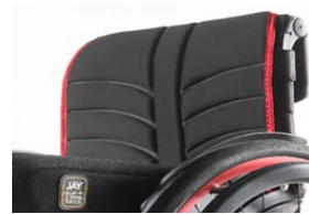
XFF 030316 Telo schienale nero EXO EVO, imbottito, regolabile, con 2 tasche