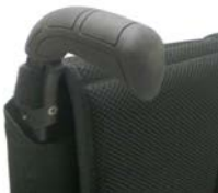
XFF 030201 Maniglie di spinta standard lunghe