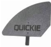
XFF040107 Spondine diritte in plastica estraibili nere