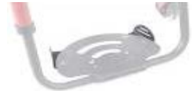
XFF050127 Supporti fermapiiedi laterali per pedana unica