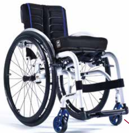
XENON² FF FÖRSTÄRKT RAM DEN STARKA