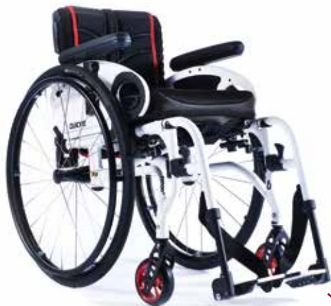
XENON² SA DEN ALLSIDIGA