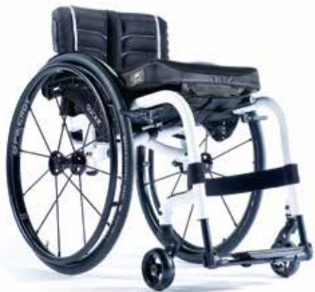
XENON² FF DEN LÄTTA