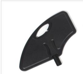
XFF040107 Sidoskydd löstagbart komposit