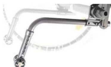
XFF090050 Tippskydd, löstagbara plug in