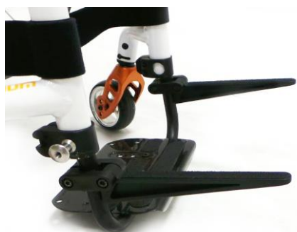
XFF090019 Caddy, väskhållare