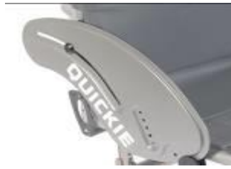
XFF040102 Sidoskydd, aluminium, utan stänkskärm