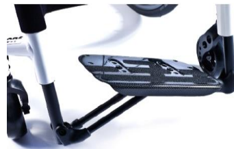
XFF050027 Fotplatta hel, lättvikt, kolfiber, automatiskt uppfällbar