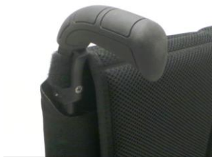
XFF 030201 Körhandtag långa