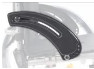
XFF040101 Sidoskydd, kolfiber, utan stänkskärm