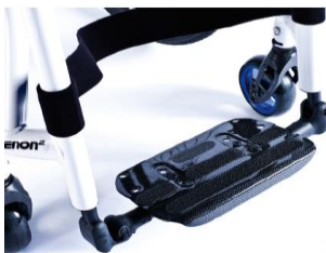
XFF050132 Fotplatta hel, lättvikt, kolfiber