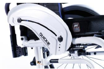
XFF040103 Sidoskydd aluminium, med stänkskärm