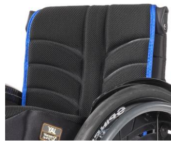
XFF 030317 EXO PRO Evo ryggklädsel