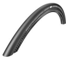
XFF070107 Schwalbe One