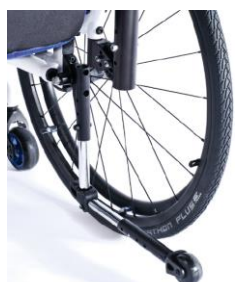
XFF090004 Tippskydd, swing away