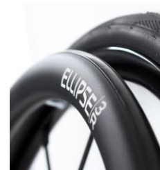
XFF070212 Ellipse 3R, svart