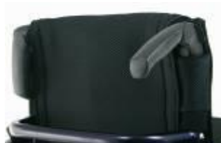
XFF 030203 Körhandtag fällbara