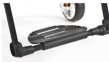
XFF050059 Fotplatta hel performance med rundad framkant