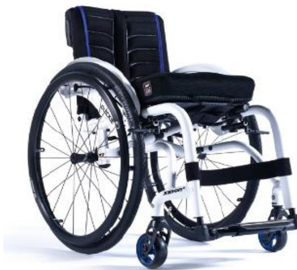
XFF090020 / 21 Förstärkt ram