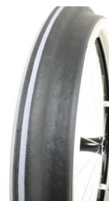
XFF070208 Drivring Maxgrepp (ergo para cp modell)