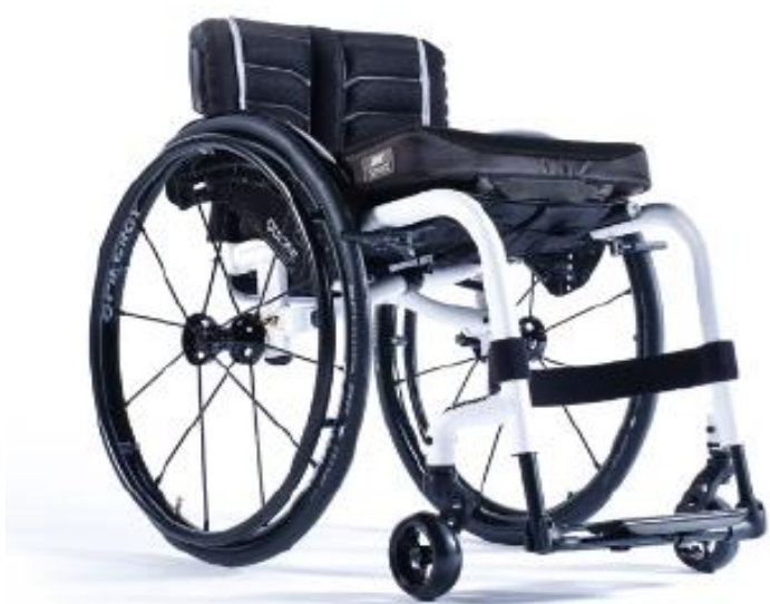
XFF010012 / 13 Öppen ram