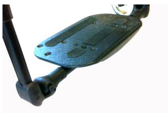
XFF050131 Fotplatta hel, komposit