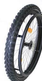
XFF07010 Mountainbike hjul