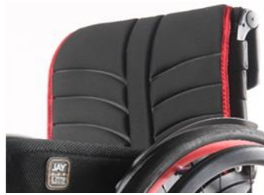
XFF 030316 EXO Evo ryggklädsel