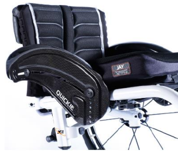
XFF040104 Sidoskydd kolfiber med stänkskärm