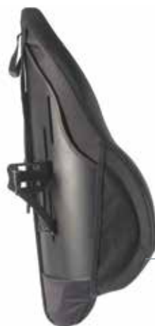
J3 Mittlerer Tiefe Kontur Rücken (MDC)