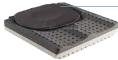
Lite / Lite P