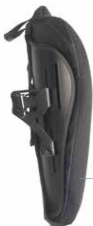
J3 Mittlerer Kontur Rücken (MC)