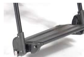
Aluminiowa platforma z reg. kąta i głębokości, podnoszona