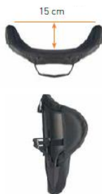
Oparcie Jay 3 Głęboki kontur