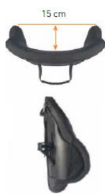
Oparcie Jay 3 Środkowy głęboki kontur