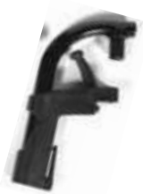
Plastikowe ramię podnóżka