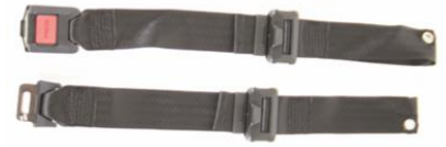
Pas pozycjonujący ze sprzączką