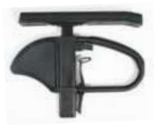
Podłokietnik na słupku z reg. wysokości