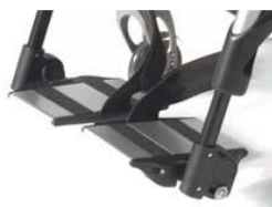
Aluminiowe podzielone platformy podnóżka z reg. kąta i głębokości