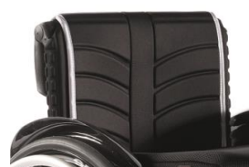
LII030316 Tapicerka EXO standardowa