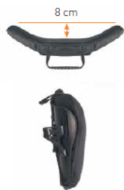
Oparcie Jay 3 Średni kontur