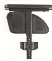
Podłokietnik na słupku z reg. wysokości przy pomocy narzędzi