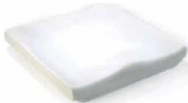
Jay Basic (zdjęcie nie pokazuje tapicerki)