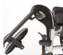
Unoszone ramię podnóżka