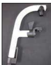
Aluminiowe ramię podnóżka