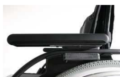
Podłokietnik z reg. wysokości przy pomocy narzędzi