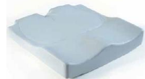
Jay Easy Visco (zdjęcie nie pokazuje tapicerki)