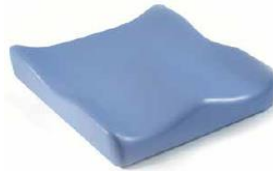
Jay Soft Combi P (zdjęcie nie pokazuje tapicerki)