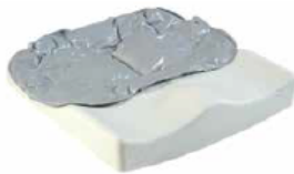
Jay Easy Fluid (zdjęcie nie pokazuje tapicerki)