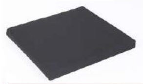
Poduszka na siedzisko z czarnym pokrowcem na suwak