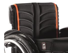
LII030317 Tapicerka EXO PRO oddychająca