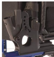
Oparcie z regulacją kąta