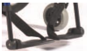
Podzielone plastikowe platformy podnóżka z reg. kąta