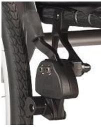
Hamulec z dźwignią na wys. kolan