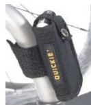
Kieszonka na telefon