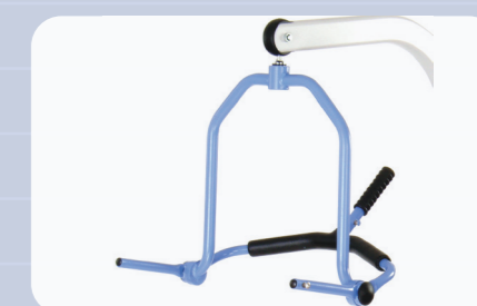
Barra de suporte das cestas com 4 pontos de fixação

Com a Presence podem-se utilizar dois tipos de barra de suporte: a barra standard ou a de 4 pontos de fixação. Esta opção permite ao cuidador escolher o sistema que melhor se adapte ao seu caso, em função do nível de ajuda e suporte que o paciente necessite. Com a barra de 4 pontos de fixação, só é possível utilizar as cestas Comfort.