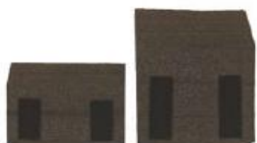
Lumbalstöd (litet och stort)