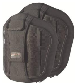
Mellan Thorakal (MT)