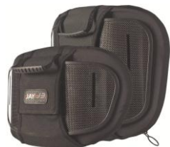
Låg Thorakal (LT)