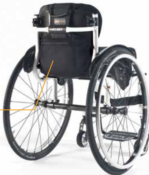
Pochette de dossier

Optez pour la pochette de dossier, discrète et élégante, pour y stocker vos effets personnels. Elle comblera également l'espace entre votre coussin et votre dossier.