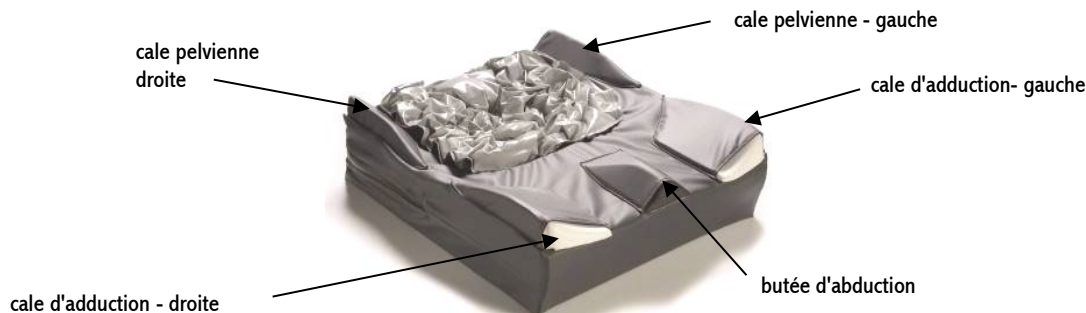
JAY Balance version positionnement et insert fluide

* Uniquement avec housse interne pour coussin avec cales de positionnement