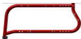
Life FF 85°