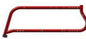
Life FF 75°