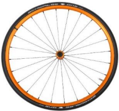
Lightweight wheel, anodized orange