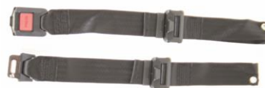
Pas stabilizujący z metalową klamrą