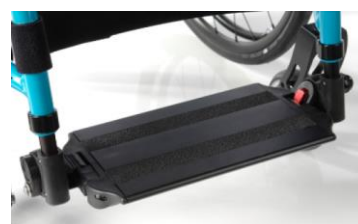
Platforma aluminiowa, z regulacją kąta i głębokości z systemem blokującym dla użytkowników ze spastycznością