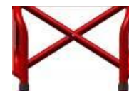
Rama FF 85° aktywna, taliowanie 2 cm