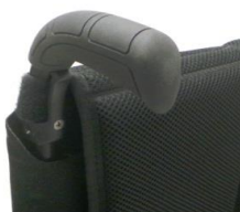
Długie rączki do prowadzenia