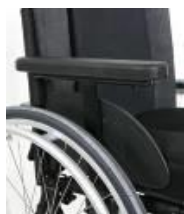
Podłokietnik na jednym słupku z regulacją wysokości