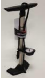
High pressure pump