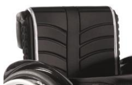
Tapicερka EXO standardowa