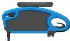
(Podłokietnik stolikowy ze stałą wysokością z poduszką 250 mm)