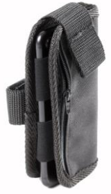
Mobile phone pocket