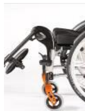
Podnoszony uchwyt podnóżka