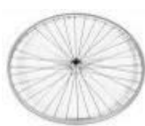
Koło z polerowaną piastą