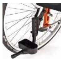
Uchwyt na kulę