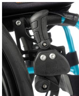
Dźwignia blokady na wysokości kolan