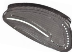
Osłona boczna z włókna węglowego z błotnikiem