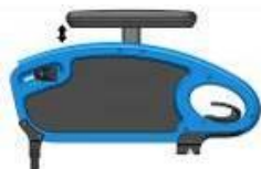
Podłokietnik stolikowy w regulacji wysokości z poduszką 250 mm)