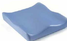
Jay Soft Combi P (na zdjęciu bez pokrowca)