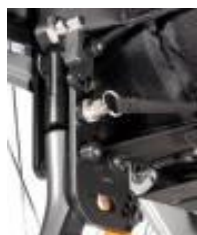
Oparcie składane z regulacją kąta, po złożeniu