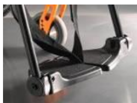
Dzielone, kompozytowe podnóżki