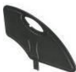
Kompozytowa odczepiana osłona boczna