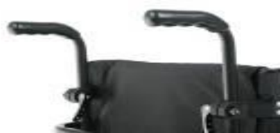
Rączki do prowadzenia z regulacją wysokości