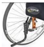
System wspomagający przy przechylaniu