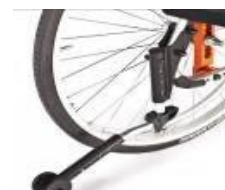
Kółko antywywrotne odchylane