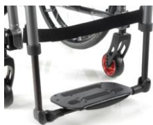
Lekka kompozytowa platforma podnóżka z regulacją kąta i głębokości