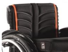
Tapicερka EXO PRO