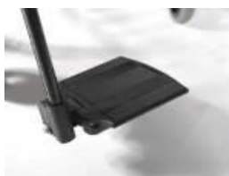
Dzielone, aluminiowe podnóżki