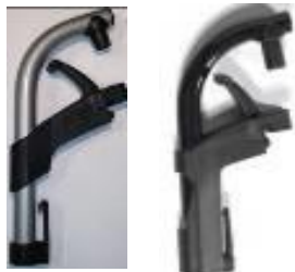
Uchwyty podnóżka 70°/80°