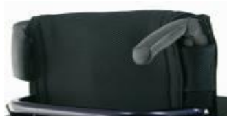
Składane rączki do