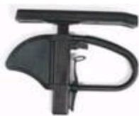
Podłokietnik z regulacją wysokości