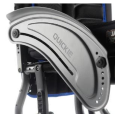
Osłona boczna aluminiowa z błotnikiem