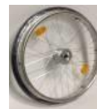
Koło z hamulcem bębnowym