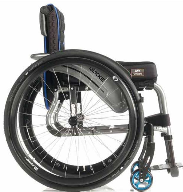
Quickie Life R com apoios de pés fixos

Além disso, graças ao desenho modular da parte frontal é possível regular a profundidade do assento ou modificar uma vez configurada a cadeira o tipo de estrutura: o ângulo seleccionado ou inclusivamente converter os apoios de pés fixos em apoios de pés desmontáveis e vice versa