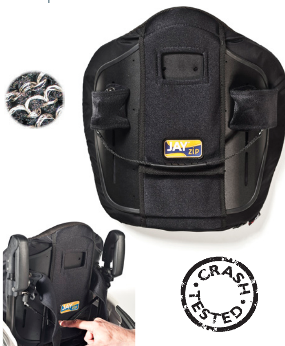
Fácil de instalar e retirar