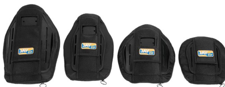
4 Alturas disponíveis em cada largura: 15, 20, 25 ou 30 cm