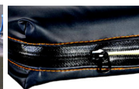
Funda e costura impermeáveis