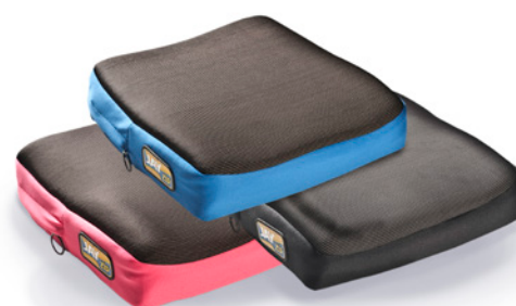
Opção de cor na funda