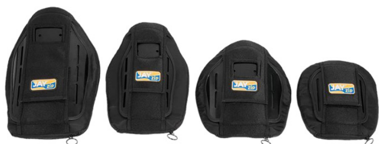
4 alturas disponibles en cada ancho : 15, 20, 25 o 30 cm