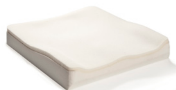
Base de espuma de 2 capas