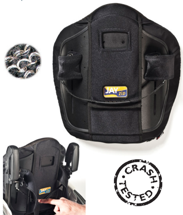
Fácil de instalar y retirar