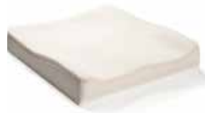
Base double densité de mousse