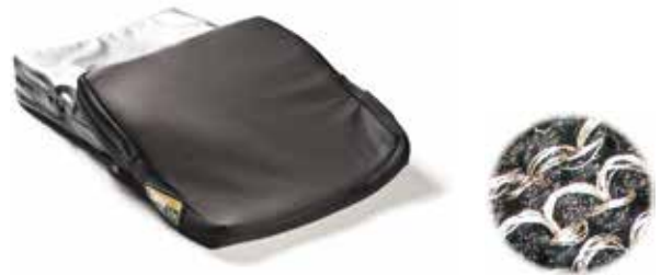
Housse interne et externe