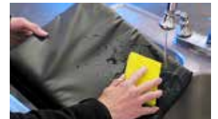
Facile à nettoyer et à laver