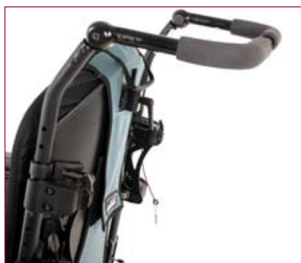
Disponível com punhos fixos, asas de empurrar ajustáveis em altura ou encosto reclinável.