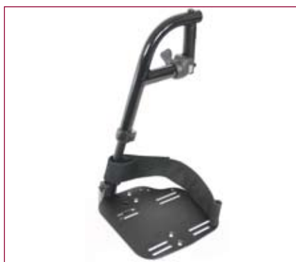
Apoios de pés standards ou montado alto, a 70° ou 80°. Opção de apoios de pés eleváveis para um maior conforto.