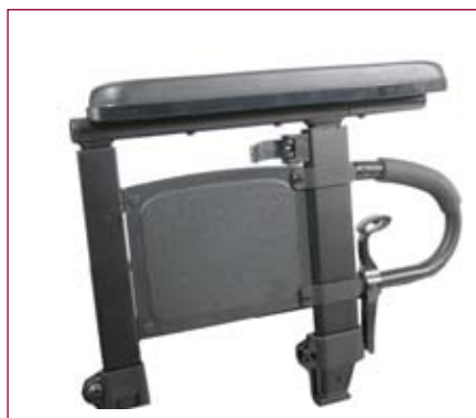
Diferentes opções de apoios de braços: ajustáveis em altura, com encaixe de tubo duplo, com ou sem apoio transfer...

A gama de acessórios e opções disponíveis na SR45 corresponde às necessidades de diferentes tipos de usuários: Diferentes tipos de apoios de pés, apoios de braços, punhos, travões... Tudo o que o usuário ou acompanhante necessitam para garantir um elevado nível de conforto.