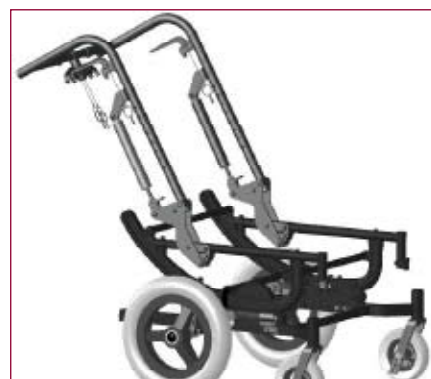
Encosto reclinável (opcional). Combinado com a basculação proporciona uma redução ótima da pressão.