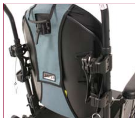
Compatível com a ampla gama de almofadas e encostos Jay e com ao apoios de cabeça Whitmyer