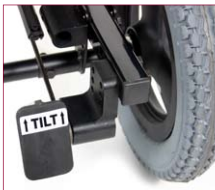
Opção de basculação mediante pedal (sem cabos) que facilita a basculação.