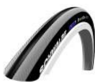
Schwalbe Right Run