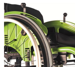
Skyv for å låse, integret i klesbeskytter, Safari