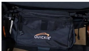
Veske, liten, sort