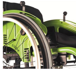
Klesbeskytter, aluminium, skjerm, kuldebeskyttelse (her også med Safari bremses)