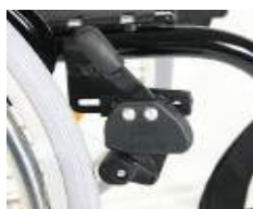
Brems høy kompositt