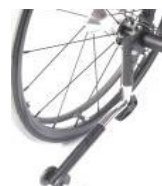
Tippesikring S/A (svingbar)