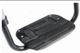
Plast, vinkel- og dybdejusterbar