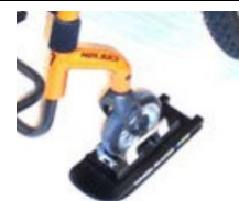
Wheelblades - Ski til svinghjul