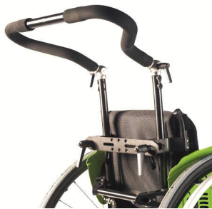
Kjørebøyle, høydejusterbar, bredde og vinkeljusterbar