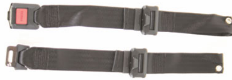
Hoftebelte med lås