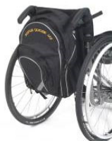
Veske, stor, Ryggsekk