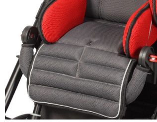
Protector de rodillas para el reposapiés