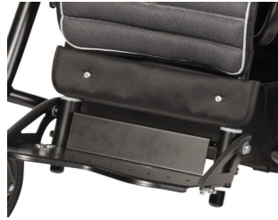
Soporte para pantorillas