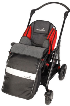
Saco de invierno