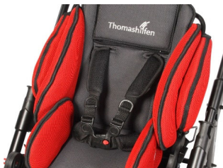
Cinturón en H