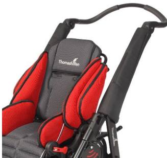
Protectores de tubo