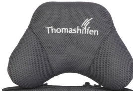
Reposacabezas con soporte sub-occipital