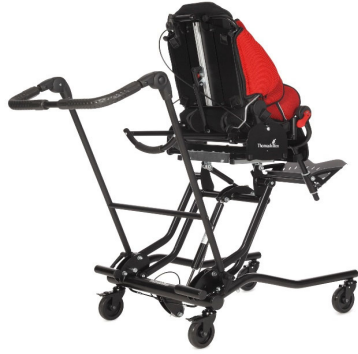
Asa de empuje para base de interior