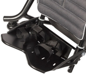
Cinchas para los pies