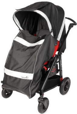
Saco con capota cuerpo entero