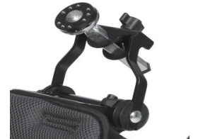
Adaptador para reposacabezas