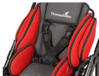
Peto mariposa dinámico de neopreno