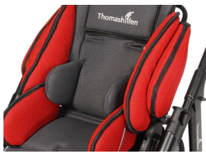
Soportes de tronco