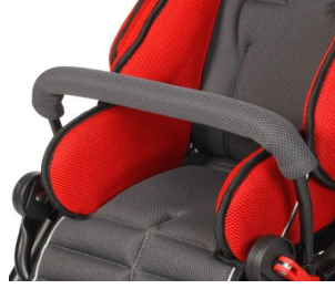
Barra protectora curva reforzada