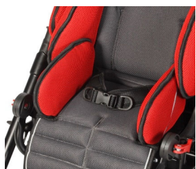
Cinturón pélvico de 2 puntos