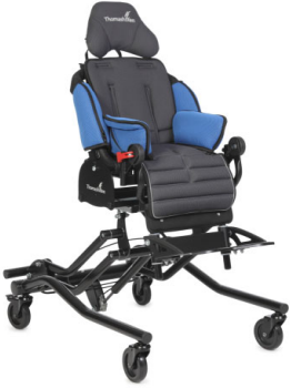
Base para interior Q hi/lo