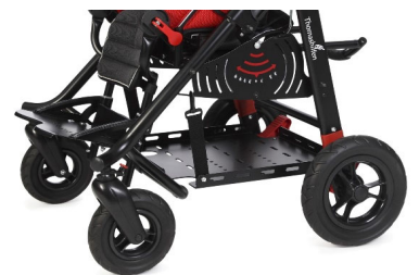
Bandeja para sistemas ventilatorios