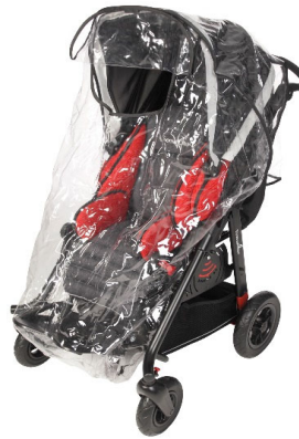
Funda completa lluvia transparente