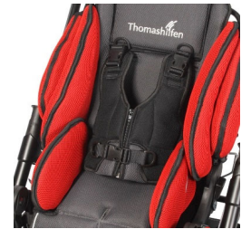
Chaleco de seguridad