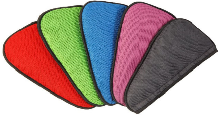
5 colores disponibles para los laterales