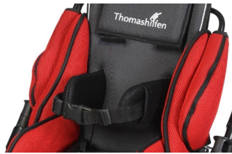
Soportes de tronco con cinturón