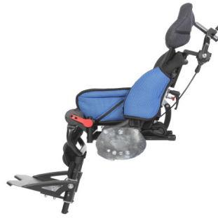
Unidad de asiento Easys Mdular S