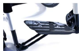
Plataforma auto-plegable de carbono