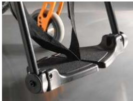
Plataformas individuales de composite