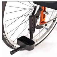
Tubo de cola con soporte de bastones