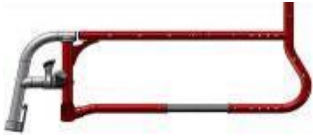
Armazón con reposapiés desmontables