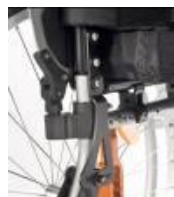
Respaldo ajustable en ángulo de -12^{\circ} a 12^{\circ}