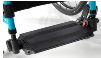
Plataforma única de aluminio, ajustable en ángulo con sistema de bloqueo