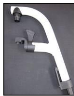
Reposapiés a 70°