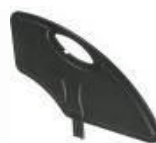
Protector de carbono con fender