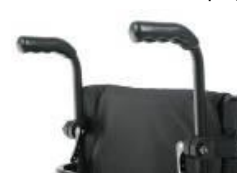
Empuñaduras ajustables en altura