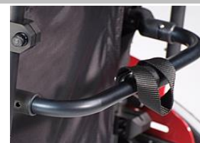
Barra rigidizadora auto-plegable