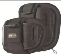
Torácico Inferior (LT)