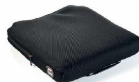
Cojín Jav Lite