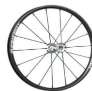
Ruedas Spinergy, 18 radios