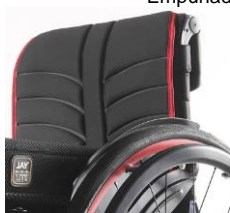
Tapicería de respaldo EXO EVO