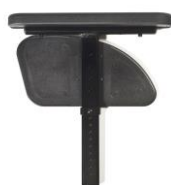
Reposabrazos ajustable en altura mediante herramientas