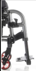
Reposapiés a 90°