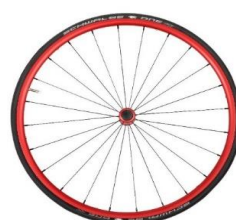
Carrete y llanta rojo anodizado