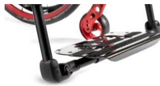
Plataforma única ligera de carbono