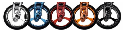
LLantas en color anodizado