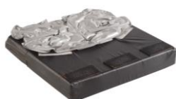
Cojín Jay Xtreme Active (imagen sin funda)