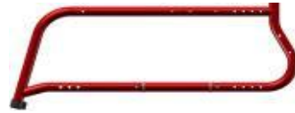
Armazón a 105° con reposapiés fijos