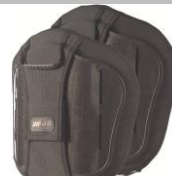
Torácico Medio (MT)