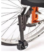
Ruedas de tránsito