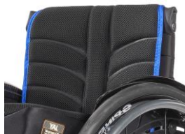
Tapicería de respaldo EXO EVO PRO