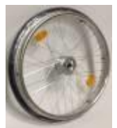
Ruedas con frenos de tambor