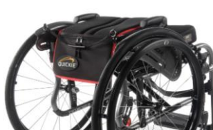
Respaldo partido (plegable hacia delante)