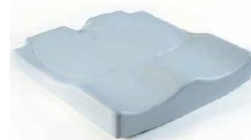
Cojín Jay Easy Visco (imagen sin funda)