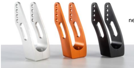
Horquilla de aluminio, negro, naranja o gris plate