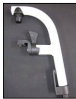
Reposapiés a 80°