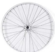
Ruedas con radios cruzados