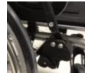
Freno de hemipleja