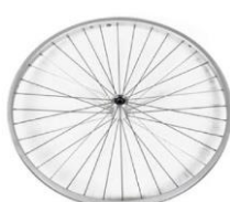
Ruedas de diseño