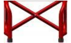
Armazón a 95 ° con reposapiés fijos y curvatura de 2 cm