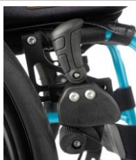
Freno de rodilla