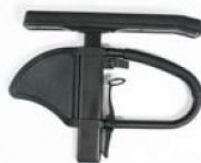
Reposabrazos ajustables en altura Quickie