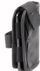
Soporte para el móvil