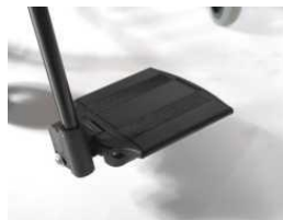
Plataformas individuales de aluminio