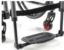
Plataforma única ligera de composite