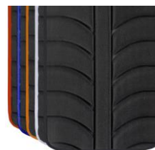
Colores ribetes tapicerías EXO EVO