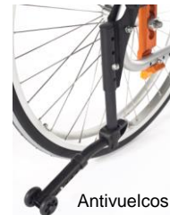
Antivuelcos abatibles ligeros